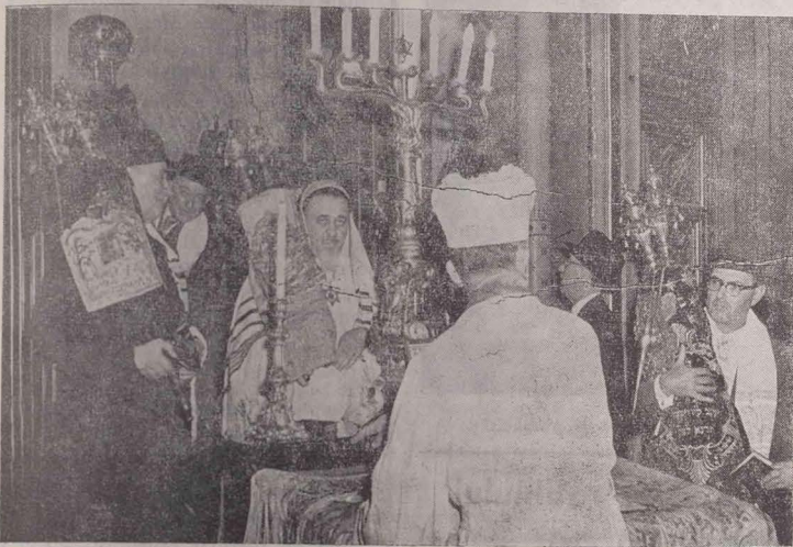
Cîteva minute înainte de Kol Nidrei 5726 la templul coral din București (I)

אין דער בוקארעשער באר-שול א פאר מינוט פאר כל נדרו