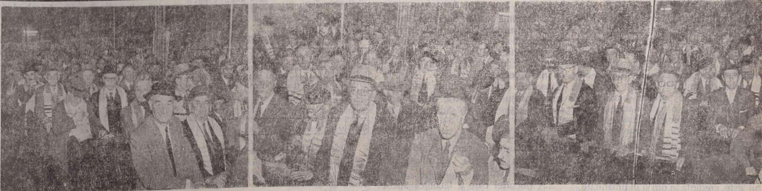
Cîteva minute înainte de Kol Nidrei 5726

Federația Comunităților Evreiești (M) București, str. D. Răcoviță, 8.