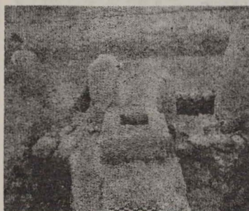
Vestigii arheologice scoase recent la lumină

Cercetătorii au ajuns la concluzia că minele din Timna au funcționat în timpul lui Moșe