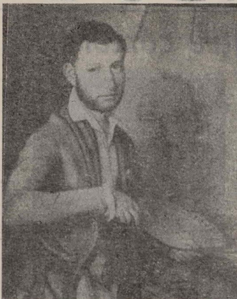
Const. Daniel Rosenthal: Autoportret

Înflăcăratul patriot și democrat a mormărit între prietenii săi cei mai apropiați, mai intimi și mai prețioși și pe pictorul Constantin Da- niel Rosenthal care a luat parte activă în miș- carea revoluționară de la 1848 și pentru care acțiune a fost ucis de autoritățile austro-ungare.