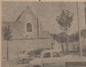
Fașada noii sinagogi din oraș

Locuințele evreilor se aflau în cartierul Châtelet, aproape de incinta fortificată, în apropierea centrului comercial. Sub Charlemagne ei aveau dreptul să posede bunuri imobiliare și să ocupe funcția de collector de impozite, bucurîndu-se de o perioadă liniștită. Mai tîrziu, în epoca cruciadelor, au fost de mai multe ori expulzați. Expulzați în 1183 de către Philippe August, evreii au fost rechemati tot de acesta după 15 ani. Fiecare evreu din Orleans, cap de familie, a fost obligat să plătească 160 de livre