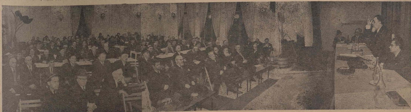
Aspect de la consfătuirea pe țară a comunităților evreiești mozaice (20—22 februarie 1972).

Conferința cheamă pe toți coreligionarii să sprijine în continuare activitatea comunităților, să-și aducă pe deplin contribuția la întreținerea și buna funcționare a așezămintelor noastre, să fie aceiași buni evrei și buni cetățeni ai Republicii Socialiste România.