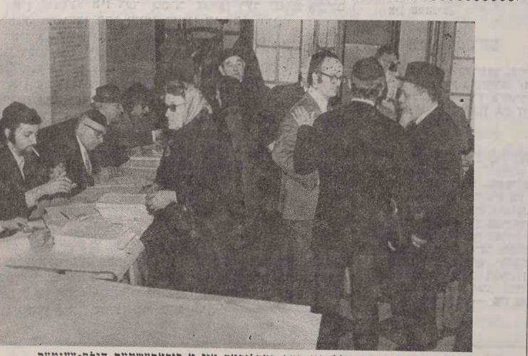
דער רב הכולל און הער קאלקאָף אין א באקארעשטער הילף-צענטער.

האָט פראַקטישט ווי א באונדערט געשעניש דאָס ברוישיגען פון דעם דער "אין ליכט פון דער תורה" סע-רע צייטונגען און צייטשריפט פון יש-ראל, ענגלאַנד, פראַנק-רײ, אמעריקע, האָבן פראַקטעלעכע ארטי-קלען און רעצעניעס וואָס אונטערשטייען דעם באונדערן ווערט פון בוך. מיר ברענגען איר-גיטק אויסצוגן פון די דערשינענע רעצענ-זיען: "דער אינהאַלט פון בוך איז אינדעראַמטן בלויזט און ליכט פון דער תורה, לויט דער אלטער יידישער טראַדיציע. מיט אן סטאלייזונגען אין אר-מדינת און די וויכטיקע פון דער גארער וועלט האָט פראַקטישט ווי א באונדערט געשעניש דאָס ברוישיגען פון דעם דער "אין ליכט פון דער תורה" סע-רע צייטונגען און צייטשריפט פון יש-ראל, ענגלאַנד, פראַנק-רײ, אמעריקע, האָבן פראַקטעלעכע ארטי-קלען און רעצעניעס וואָס אונטערשטייען דעם באונדערן ווערט פון בוך.