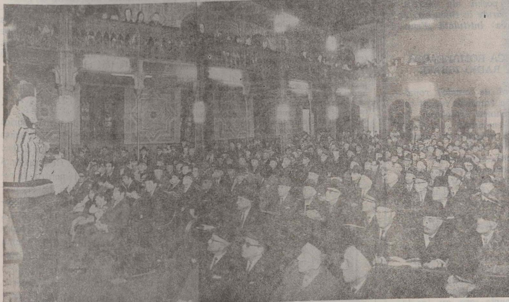
Templul coral din București în prima seară de Pesah. — אין דער בוקארעטער כאָר-שול. די ערשטע סערה (פארן דאווענען מערים)