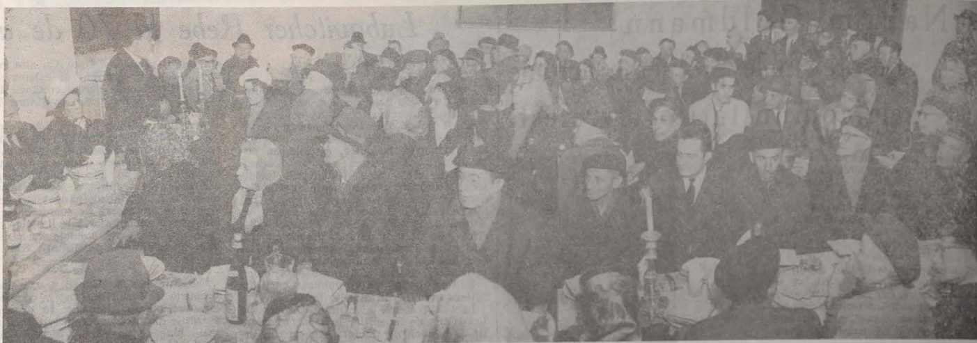
Sederul Kol dițrih de la templul coral.