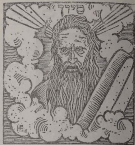
Moșe primește Tablele legii (gravură)

Atunci Dumnezeu certă pe profet, zicîndu-i: „Cum fiul meu, ai mințit?” Dar Moșe răspunse în fața lui Dumnezeu: „Rege al lumii, ai avut un teazaur ascuns de care te bucuri în fiecare zi; și eu să-mă fălăsc că am acest teazaur?” Și Dumnezeu spuse slujitorului său: „Pentru că te simți mic în fața Torei mele, iată: va purta numele tîu”. Astfel precum stă scris: „Aduceți-vă aminte de Tora lui Moșe, și rămăși idolii? Adu-ți aminte de Sabat, spre a slujitorului meu”.