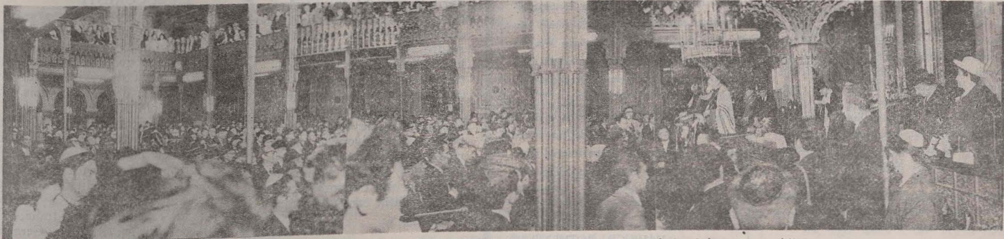
Templul coral din București în seara zilei de 5 mai 1972. Un Kabbalat Șabat memorabil...