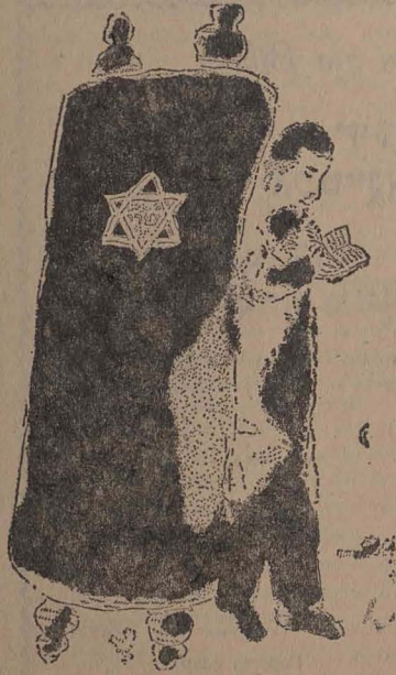
desen de MARC CHAGALL

Talmudul abundă în proverbe. Cele mai importante surse sînt tractatele Avot, Avot de-Rabi Nathan, Derek Erez Raba,