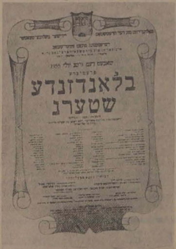
Afiș pentru spectacolul „Stele rătăcioare” (1955)

În cei 25 de ani de activitate, strădania teatrului a fost de a-și însuși și a continua