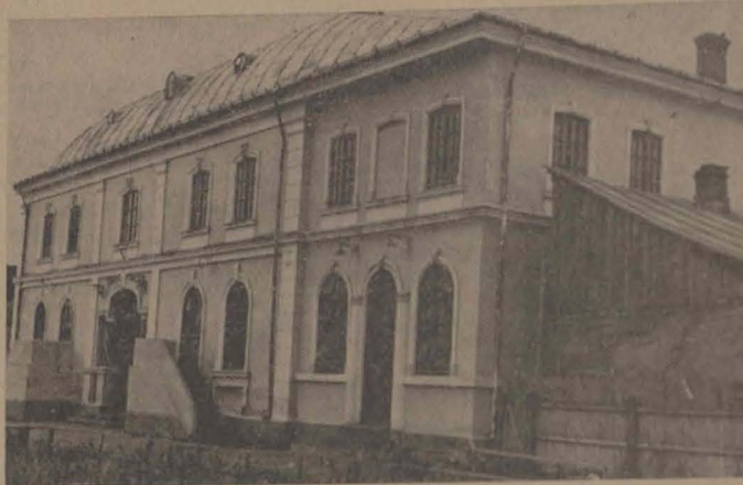
Sinagoga principală din Bacău