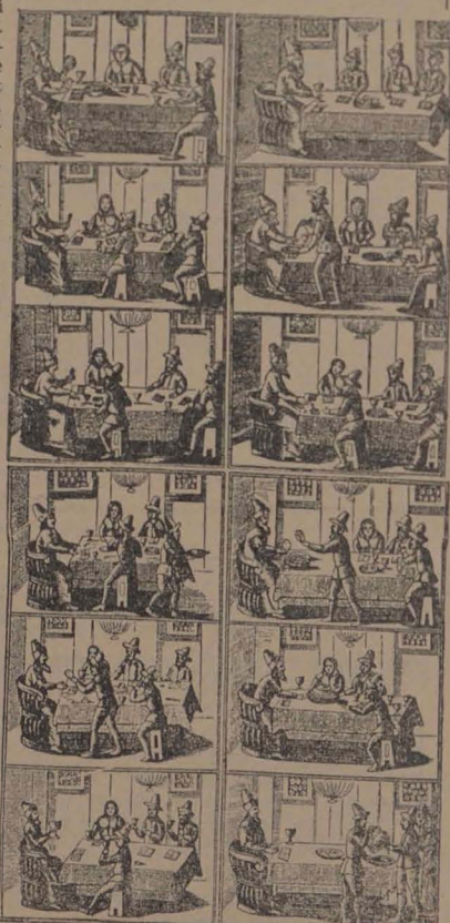
Scene din timpul Seder-ului (ilustrație la o veche Hagada)

În timpurile noastre, impresionanta dramă muzicală a lui Arnold Schönberg „Moșe și Aaron“ este pătrunsă de un adînc sentiment religios. În 1932, cînd a fost creată, s-a considerat că punerea ei în scenă nu este posibilă. Totuși, după prezentarea ei la Zürich, acum 16 ani, se află azi cuprinsă în repertoriul a numeroase scene.