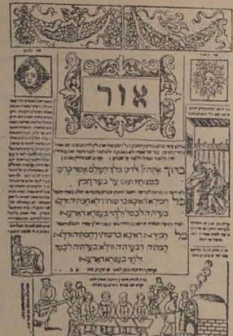
Pagini din ediții rare ale Hagadei: Praga, 1526 (stînga); Mantua, 1561 (mijloc); Amsterdam, 1695 (dreapta).