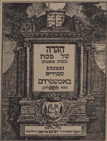
Prima filă a Hagadei tipărite la Amsterdam în anul 1781.

Pentru refuzul său demn de a asculta porunca tiranului care interzisese învățura Torei, Akiva a pierit de moarte de martir. Această jertfă, de care ne amintim și cu prilejul Sederului din casa sa de la Bnei Brak, este un exemplu sublim de păstrare a credinței. Amintirea sa, ca și a celorlalți maeștri prezenți la acel Seder, este veșnic vie în inimile noastre.