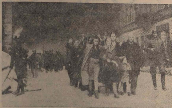
Femei, bătrâni, locuitori ai ghetoului, sint duși sub escortă spre trenurile morții...

Răscoala ghetoului din Varșovia va rămâne în vechi în memoria generațiilor. „Ceea ce s-a întâmplat — a scris Mordhe Anilevici, comandantul răscoalei — într-o scrisoare adresată lui Ithak Tukerman (Antek), care a preluat conducerea răscoalei după moartea acestuia — în-trece cele mai îndrăznețe visuri ale noastre. De două ori au fost nevoiți nemții să fugă din ghetou...”