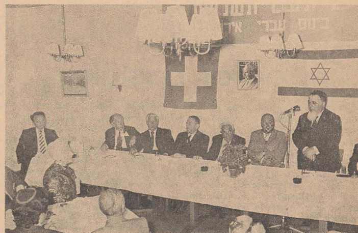
Grindelwald, Elveția, 8 iulie 1974. Eminența Sa d. Șef rabin dr. Moses Rosen prezidențiază ceremonia de închidere a Congresului Uniunii Mondiale a ebraiștilor (Brit Ivrit Olamit).

Cu excepția celei din Surinam, comunitățile din Caraibi sînt compuse din descendenți ai vechilor familii venite din Spania, Portugalia, Olanda și Anglia, la care s-au adăugat un număr relativ mic de evrei care au părăsit Europa răsăriteană în anii 1930—1940. Pe planul vieții religioase, cele mai multe comunități sînt împărțite între cele două rituri — sefard și askenaz. Interesul pentru cultura și tradiția sefardă precumpănește chiar printre evreii de rit askenazit, ceea ce ar putea duce la o unificare într-o perspectivă destul de apropiată. O prefigurare a acestei tendințe ne oferă comunitatea din Jamaica. În sinul acestei comunități, formată în aproape egală măsură din sefarzi și askenazi s-a ajuns la o convergență a tradițiilor celor două rituri, pe o bază sefardă.