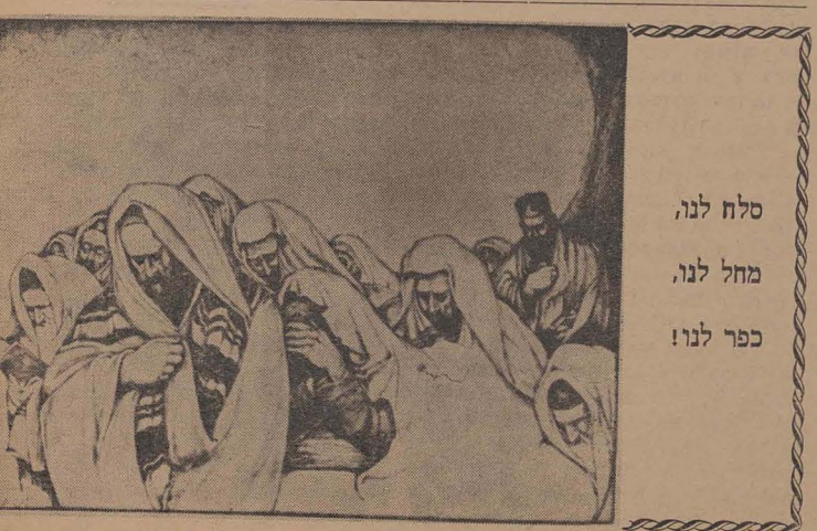
(סוף דף זייט 9)

רב הכולל און פרעזידענט פון דער פעדעראציע פון די יידישע קהלות פון דער סאציאליסטישער רעפובליק רומעניע