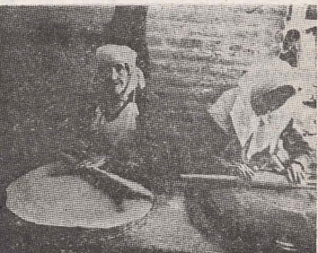
IRAN: Și aici evreii pregătesc matzot de Pesah

În Argentina apar două cotidiane în limba idîș — „Idische Zeitung“ și „Die Presse“ — precum și o revistă lunară idîș, „Davke“, dedicată problemelor de filozofie iudaică. Apar, de asemenea, două publicații săptămînale în limba spaniolă, „Mundo Hebreea“ și „La Luz“, ambele editate de comunitățile sefarde din Buenos Aires.