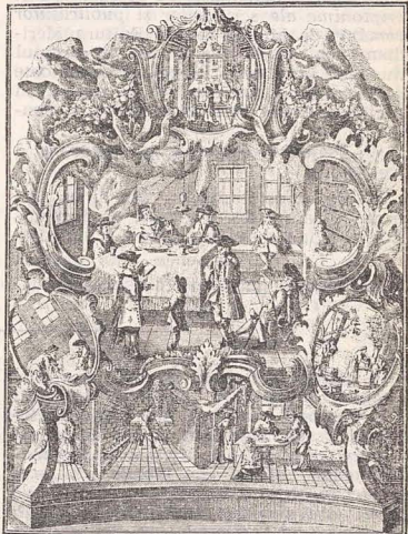
Sederul și pregătirile de Pesah, gravură germană din anul 1748.

stă dimensiune vom recurge la evocarea unei mici povestiri talmudice. Un înțelept a întrebat o fetiță de la fară care este drumul cel mai lesnicios pentru a ajunge la orașul apropiat. Fetița a răspuns: „Există două drumuri-unul este scurt și