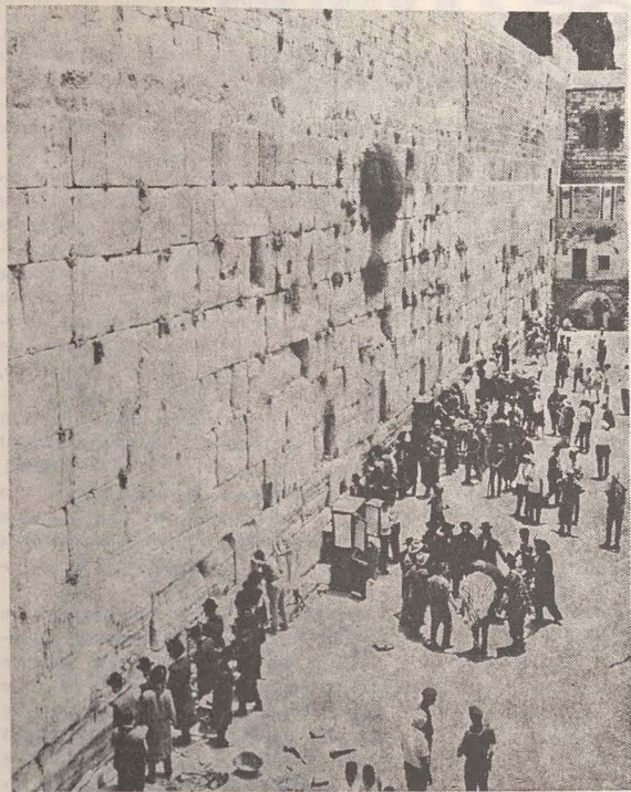
KOTEL, Zidul de Apus, vestigiul sacru al Templului din Ierusalim