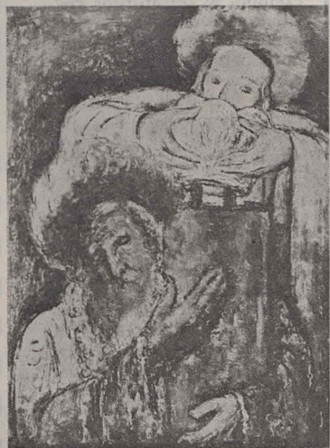
Pictură în ulei de REUVEN RUBIN