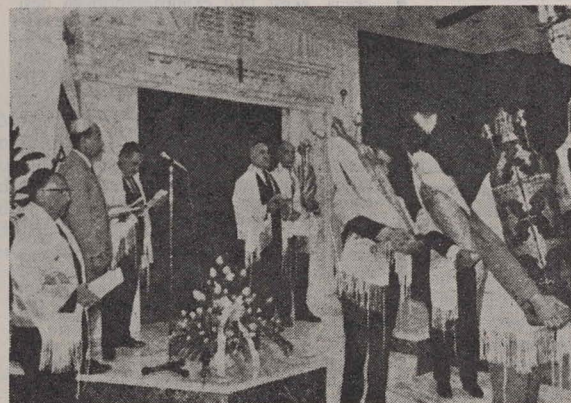
Serviciu divin la sinagoga din orașul Kobe

Primii evrei au venit în Japonia în a doua jumătate a secolului al XIX-lea, fiind originari din Germania, Rusia și America. Pentru ei această țară reprezenta o mare necunoscută și foarte puțini se gîndeau să se stabilească definitiv în această regiune îndepărtată. Acest sens de temporalitate a afectat desigur și înființarea de comunități în adevăratul sens al cuvîntului. Cu trecerea anilor s-au ivit însă forme ale unei vieți comunitare. Cu toate că Yokohama a fost cel dintîi oraș care număra și evrei în colonia sa străină, totuși Nagasaki este orașul despre care se poate spune că a avut prima comunitate evreiască. Prin anul 1880 comunitatea evreiască din respectivul oraș se compunea din 50 de familii. Membrii ei au clădit sinagoga „Beth Israel”, s-au cumpărat teren pentru un cimitir. Ulterior a fost adus un rabin din Manciuria, s-a deschis o școală evreiască și a fost înființată o societate de binefacere.