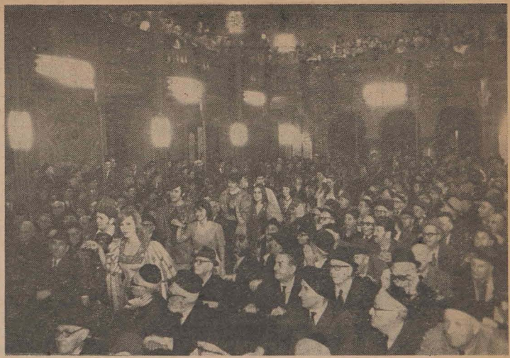
Purim 5736... În Templul coral din București

De la Istanbul drumul ne-a purtat la Izmir (numit înainte Smirna) orașul unde a văzut lumina zilei falsul Mesia Sabetai Zwi. Am vizitat vechile orașe grecești, în care altă dată își aveau sălășii importante comunități evreiești. La Sardis am vizitat o sinagogă care în ghidul turistic este trecută ca cea mai veche din lume. La Efes ni s-a spus că recent, cu ocazia unor cercetări arheologice, a fost descoperită altă sinagogă, pe cale de a fi scoasă la lumină.