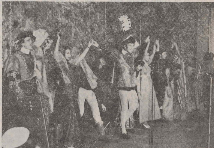
Purim 5736... Scenă din Prolog, interpretat de cursanții de la Talmud Tora

Șef rabin al cultului mozaic, Președintele Federației Comunităților Evreiești din R. S. România