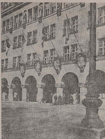
În această clădire au fost judecați...