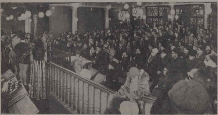
אויך אין דער יידישער קהילה פון גלאץ און פורים יום טוב...