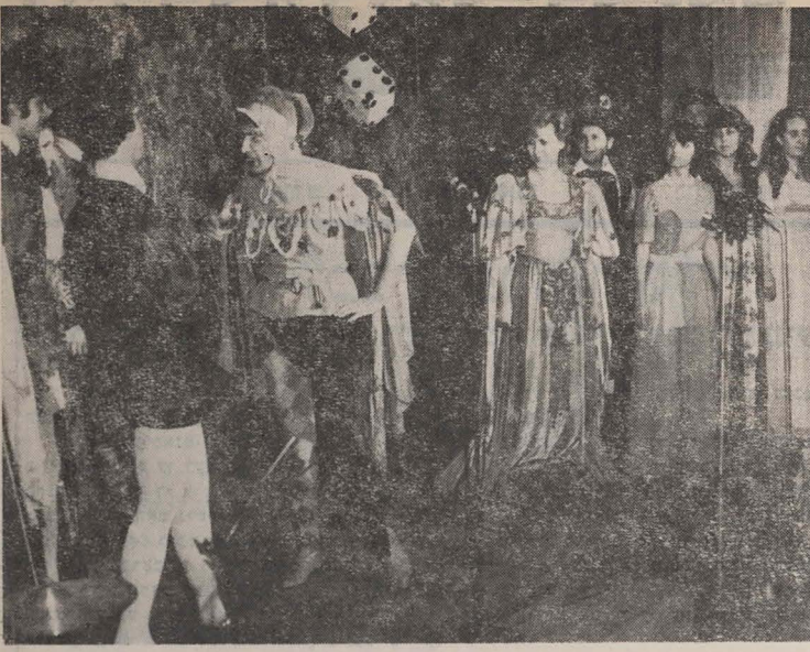
„פורים־שפיל“ אויסגעפירט פון די תלמידים פון דער בוקארעשטער תלמוד תורה.

די פורים פּיערונג איז צוגעגרייט געוואָרן מיט ליבשאַפט דורך די קורסאַנטן פון דער תּל- מוד־תּורה. די לייטונג פון דער ייִדישער קהילה האַט פאַרזאָרגט אז זיי אַלעס יידן אַדער קראַמק זאָלן באַקומען תּאָהיִם דעם ייִדישן פּאַלקלאַר. שלוה־מנחת וואָס איז באַשטאַנען פון שפּייזן און געבעטע.