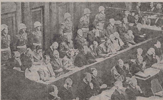
...conducătorii naziști în boxa acuzaților

E lîmpește: ne referim la dosarul procesului de la Nürnberg al marilor criminali de război, de la judecarea și osîndirea cărora se împlinesc 30 de ani. Vîrsta unei generații, care, din fericire, nu are ca celelalte două ce o preced groaznicele amintiri lăstate de trăirea anilor negri al războiului. Nu s-ar putea afirma că această generație nu a aflat nimic despre cele petrecute în deceniul 1935—1945, de vreme ce literatura concentraționistă, cea memorialistică, scrierile istorice, documentele oficiale date publicității sau simpla cercetare a presei timpului oferă oricui un imens material lămuritor. Dar poate că nicăieri nu sînt ogîndite mai bine și mai convingător faptele, și nu apar mai vizibil înnovați făptașii decît din filele în care s-au consemnat, în limbajul reținut al instanței de judecată, dezbaterile celor 403 ședințe publice care au avut loc la Nürnberg, între 21 noiembrie 1945 și 2 octombrie 1946.