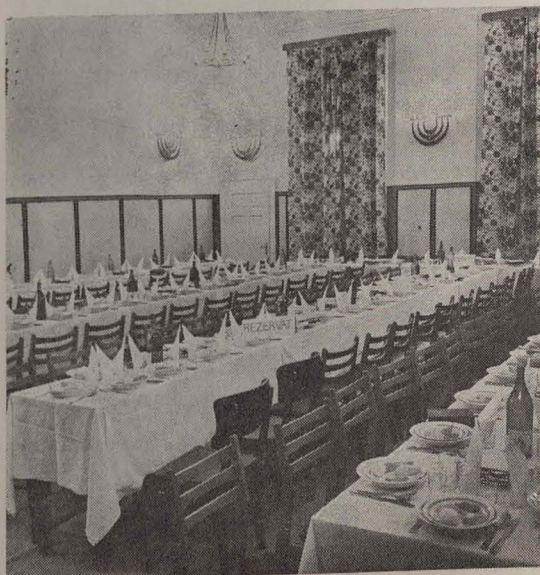
RESTAURANTUL DE LA BRAȘOV AL 11-LEA RESTAURANT RITUAL AL OBȘTEI NOASTRE