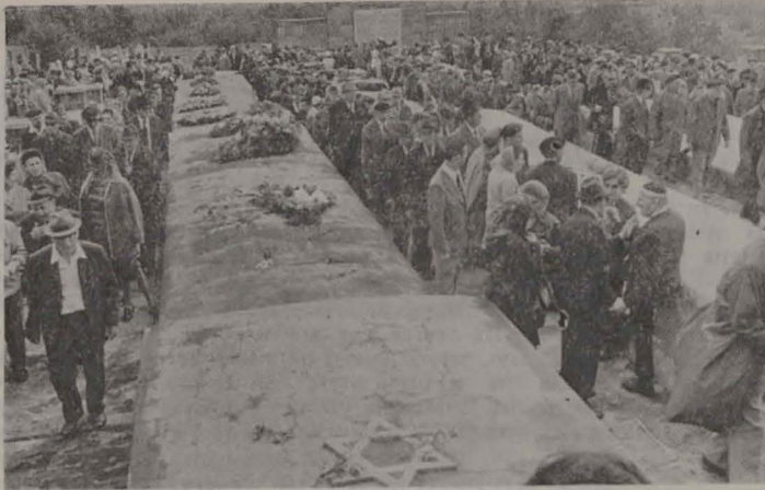
די באטייליקער אין דער נרויסער אזכרה שטעלן קרענץ בלומען אויף די מאסן־קרבים פון די קרושים פון יאסער בית־עלמין.