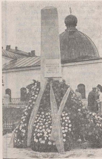
Obeliscul ridicat în fața Sinagogii Mari de municipalitate.