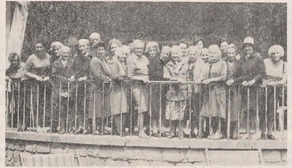
Pensionarii căminelor de bătrîni au deschis sezonul 1976...

Și în acest an casele de odihnă ale Federației Comunităților Evreiești (M) din România și-au deschis larg porțile spre a primi oaspeți în sezonul de vară. La Eforie-Nord, la Cristian și la Borsec deservienții de cult, președinți de temple și sinagogi, funcționarii Federației și ai comunităților, ca și coreligionarii păstrători ai credinței și tradiției noastre au posibilitate a-și petrece concediul în condiții optime și într-o atmosferă ce le este apropiată.