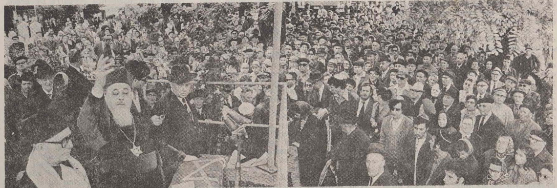
La impresionanta ceremonie de la cimitirul din Iași.

Citiți în pagina V-a o relatare a activității din timpul vizitei.