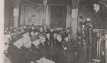
ד"ר נחום גאלדמאן האלט זיין רעדע אין בוקארעשטער כאָר-טעמפל

מיר זענען א פּאַלע - האָט דער רעדנער אָנגעהויבן - וואָס האָט געלעבט פארן גייסט און יעדן האָבן איבערגעלעבט צו זיבן גייסט. במשך דער לעצטער קהילה, פּראָפּאַגאַנדע-וויקע גייסטיקע ווערטן, פאר דער מענטשהייט. עס איז געווען נאטירלעך אז יידן זאלן שאצן אין אלע צייטן נישט די מאַכט, נישט עשירות, נאָר די גייסטיקייט. ביי אונדז זענען תמיד געווען חשוב די רבנים, תלמוד-יודיש, די לערער. צוויי טויזנט יאָר האָבן מיר נישט געהאַט קיין געשעצער, אראק זיי האָבן מיר איבערגעלעבט