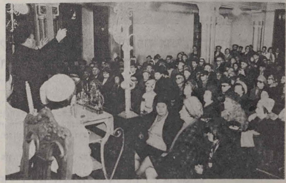
דער רב הראשי האלט א חנוכה-דרשה אין דער שיל פון פלאצעט

דערשינט צוויי מאל אין חודש * 1.1.1977 * בקארעסט