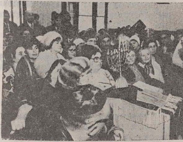
דער רב הראשי האלט א הנוכה-דרשה אין דער קהילה פון ווארטא-דאַרנע

דעם 15טן דעצעמבער 1976, פאר מיטאג, האָט ד"ר נחום גאלדמאן, באַגלייט פון ה' אראמנד קאַפּלאַן געהאַט א געשפרעך מיט דער לייטונג פון דער פעדעראציע פון די יידישע קהילות פון רומעניע.