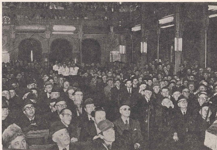
Aspect de la Templul coral din seara zilei de 14 dec. 1976. (Vizita d-lui dr. Nahum Goldmann)