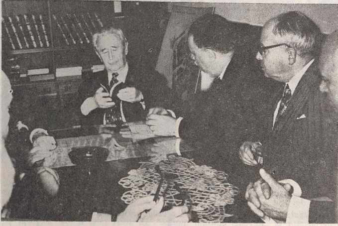
Convorbire cordială în cabinetul d-lui Șef rabin