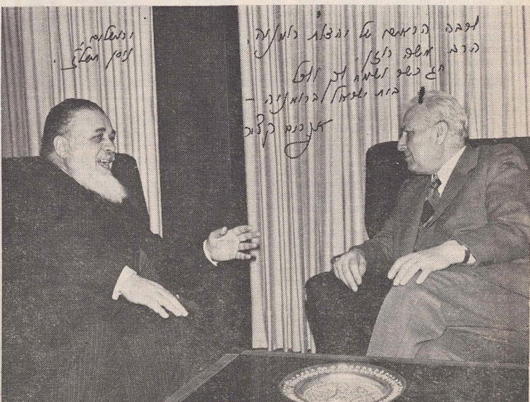
În timpul audienței cordiale la președintele statului Israel, prof. Efraim Katzir. Pe fotografie, Exceleța Sa a scris tradiționala urare de Pesah și un călduros salut Eminenței Sale și obștei evreiești din România.

Printre numeroase alte mesaje Eminența Sa a primit următoarea scrisoare din Barbados, stat din arhipelagul Antilelor (America) : „Stimate domnule Șef rabin dr. Rosen, am aflat despre pierderile tragice de vieți și bunuri, cauzate de recentul cutremur și vă rugăm să binevoiți a transmite adîncă noastră mișnire tuturor celor ce au avut de suferit. Sîntem siguri că la Dv. a fost creat un fond de ajutoare a victimelor acestui dezastru și vă rugăm ca ceul nostru alăturat, de 600 dolari, să ajungă în posesia autorităților românești competente. Noi sîntem o foarte mică comunitate, alcătuită din 12 familii. Avem o sinagogă și ne adunăm în fiecare sîmbătă la rugăciune. Ne folosim de această împrejurare spre a vă dori sărbători fericite de Pesah 5737. Vă rugăm din nou să transmiteți compasiunea noastră celor ce și-au pierdut familia sau prietenii în această calamitate. Comunitatea evreilor din Barbados”.