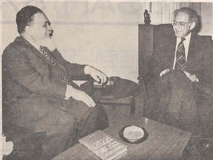
Convorbire cordială cu prof. Shlomo Avineri, secretar general în ministerul de externe al statului Israel.