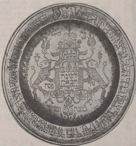
Farfurie de aramă pentru Seder

În afară de farfuriile de Seder, o atenție deosebită se acordă și cupelor de vin. Cea mai frumoasă este rezervată profetului Eliahu.