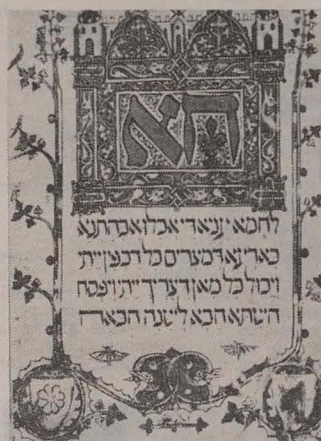
Pagină din Hagada — manuscris de la Sarajevo