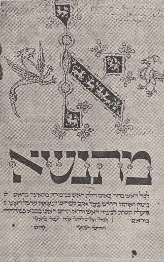
Vechi manuscris ebraic

Descoperirea este cu atât mai importantă cu cât din Talmudul ierusalimitan există foarte puține manuscrise. De fapt, talmudul numit astfel n-a fost redactat la Ierusalim, ci în alte școli rabine din Ereț Israel, în special în Tiberiada, iar tratatul Nezikin, după cite se pare, în Cesarea. Respectiva versiune a fost redactată cu mai bine de un secol înainte de Talmudul babilonian. Ambele versiuni sînt în limba arameică. Este însă interesant de menționat că proporția de termeni ebraici este mai mare în Talmudul babilonian decât în cel redactat în Ereț Israel. Daniel Bomberg, care, la numai cîteva decenii după apariția tiparului a tipărit prima ediție completă a ambelor versiuni — Talmudul babilonian între 1520—23, iar cel ierusalimitan între 1523—1524, a folosit așa numitul manuscris de la Leiden. Aparținind lui Iehiel