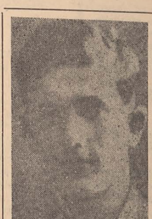
Mordehai Anielewicz Comandantul răscoalei