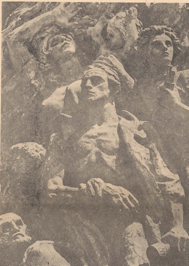
Fragment al Monumentului Eroilor din Ghetoul Varșoviei, ridicat în capitala Poloniei în 1948, la cinci ani de la izbucnirea răscoalei

potrivă închisorii Pawiak. Mărturiile emoționante despre aceste lupte sînt paginile scrise de înșiși participanții la ele, care, prin grija lui Emanuel Ringelblum, au fost ascunse în pămînt, în cutii de tablă, din care unele au fost regăsite după răz-