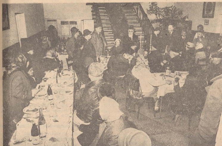
Seder la sediul Federației

Toți evreii care au vrut să sărbătorească Pesahul au avut din plin această posibilitate și în acest an.