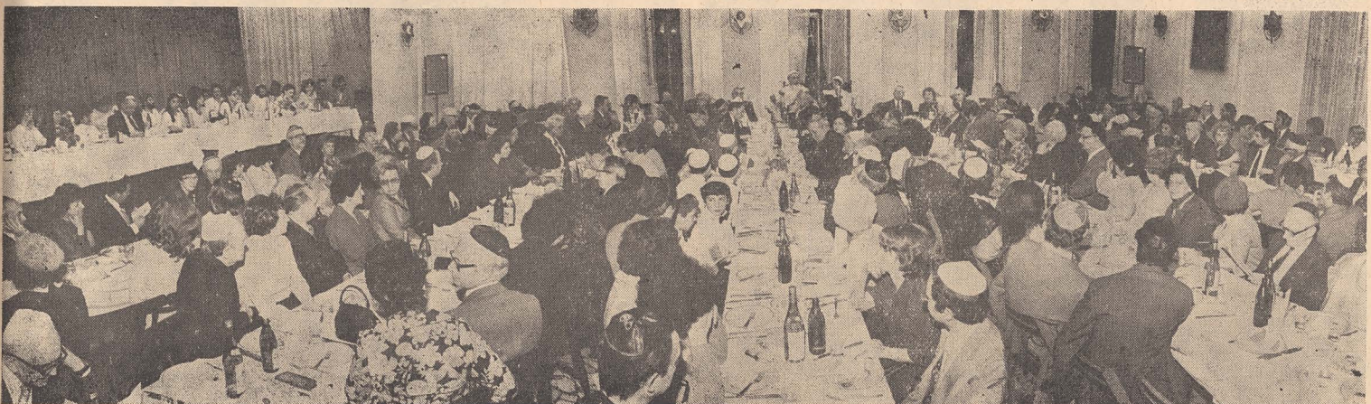
Seder la Restaurantul ritual