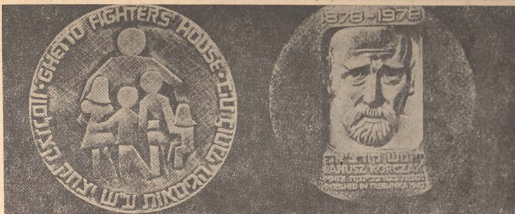
Cu prilejul comemorării Răscoalei Ghetoului din Varșovia, omagiem, cu respect, și memoria marelui pedagog și om excepțional Janusz Korczak (Henri Goldschmidt), care și-a dat viața în lupta împotriva tiraniei naziste.

Sub auspiciile Consiliului britanic al bisericilor și al altor organizații religioase, la biserica St. Georges-in-the-East a fost