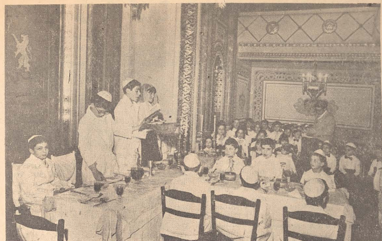
„Aceasta este piinea săracului”

Așa cum am amintit pe parcursul portajului, între 27—29 martie a.c. au avut loc manifestări de Pesah în toate comunitățile din țară. Ele fac dovada zultatelor concrete ale strădaniei comunității F.C.E., în frunte cu Eminența Sa