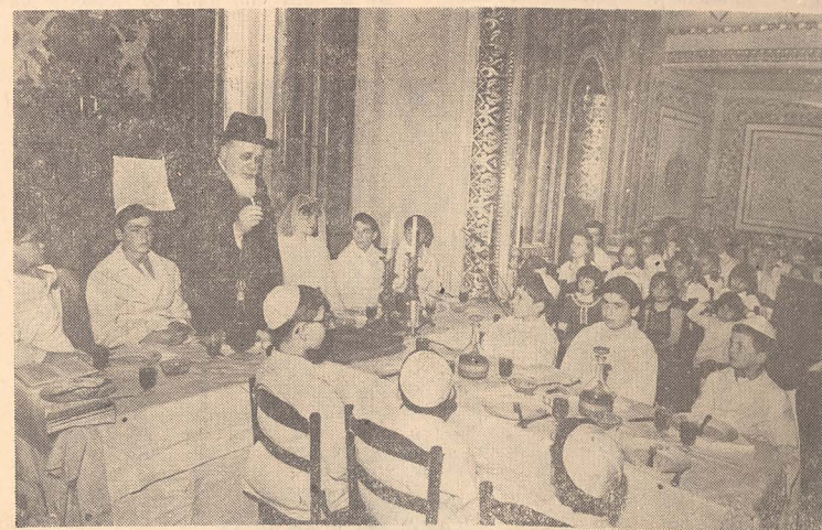
„Nu numai patru întrebări, copii! Învățați să întrebați mereu, căci acesta este iudaismul”

נישט נאך פיר קשיות, טיערע קינדער! א גאנץ לעבן זאלט איר לערנען צו פרעגן קשיות, דאס הייסט צו ווין א איר!