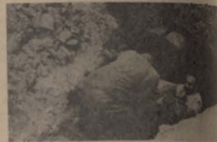
Recuperarea, în septembrie 1946, a primelor părți a arhivei lui Ringelblum

Organizația dispunea de vreo 700 de combatanți, structurați în 22 de unități de luptă, provenind din organizațiile de tineret haluțiene de stînga și de centru, precum și din organizația comunistă de tineret. Statul-major al ei avea în frunte pe Mordehai Anielewicz, comandant remarcabil prin calitățile sale organizatorice, prin talentul său militar și prin curajul său. O altă grupare de luptă a fost „Asociația Militară Evreiască” (A.M.E.), născută din colaborarea unor ofițeri polonezi de origine evreiască cu