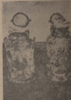
Cutii cu manuscrise din arhiva Ringelblum recuperate în decembrie 1946

tineri din organizații haluțiene de dreapta.