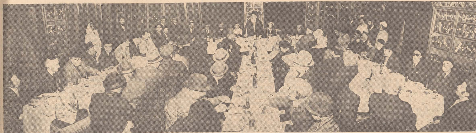
Seder cu asistați ai comunității