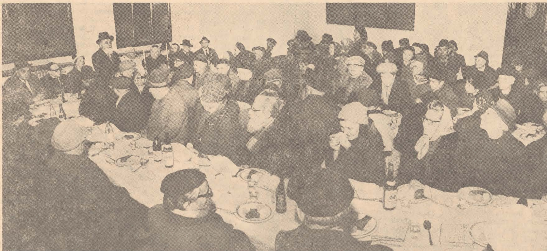
Seder cu enoriași lipsiți de familie