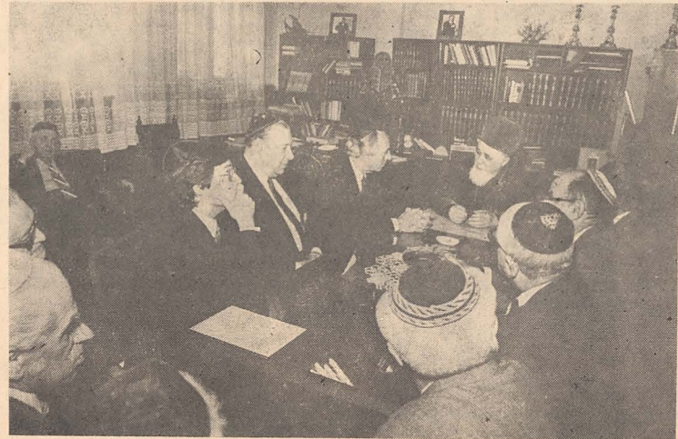
În vizită la Eminența Sa. La masă, în stînga fotografiei : dl Shimon Peres, președintele Partidului Muncii din Israel, dl Zwi Brosh, ambasadorul statului Israel în România, și dl Iosif Beilal, purtătorul de cuvînt al Partidului Muncii (citiți în p. 5 reportajul vizitei)