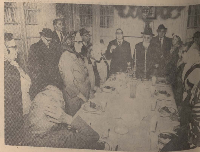
Seder la Căminul din Calea Călărași

נישט נאך פיר קשיות, טיערע קינדער! א גאנץ לעבן זאלט איר לערנען צו פרעגן קשיות, דאס הייסט צו ווין א איר!