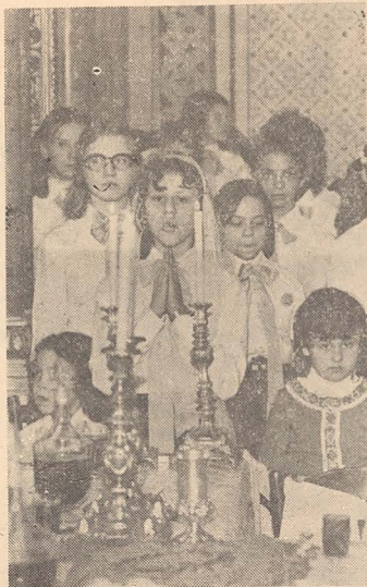
Se aprind luminările Sederului copiilor להדליק נר של יום טוב

Farao și care a adus apoi mesajul divin al eliberării, despre rolul preponderent al copilului evreu în sărbătoarea de Pesah