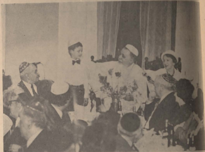
Cele patru întrebări

După uvertura oferită de copii noștri în duminica dinainte de Pesah, cele două seri de Seder, celebrate în serile zilelor de 28 și 29 martie a.c. în sala de festivități a Comunității evreilor din Bucu-