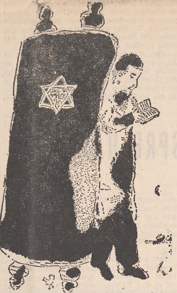
desen de MARC CHAGALL

Una din marile creații ale lui Marc Chagall ne înfățișează un Evreu singur, la marginea unui tîrșușor din care a fost alungat, pe al cărui chip se împletește o nemărginită suferință cu o nezduncinată încredere. El e singur și totuși nu este, căci tabloul ni-l arată că se sprijină de o Carte, sulul sfînt al Torei, iar privirile îi sînt îndreptate, prin studiu, spre „Acela care ne dă Tora”.