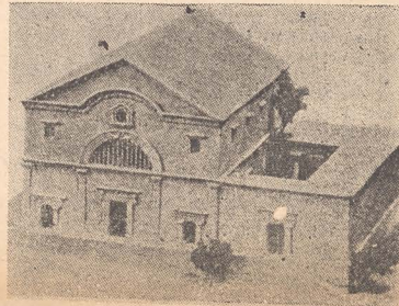
Sinagogă antică din Tel-Hum (Capernaum), Galileea

Dorința autorităților religioase centrale de a concentra activitatea religioasă a întregului popor — în limita posibilităților — în jurul clădirii de pe Muntele Casei a împiedicat fără îndoială multă vreme dezvoltarea sinagogilor. Abia pe