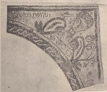
Fragment de mozaic din sinagoga de la Beit Alfa

În ciuda condițiilor arhitectonice exterioare modeste, sinagogile de tip B erau