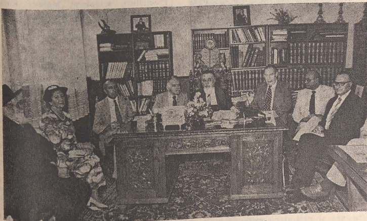
In cabinetul de lucru al Eminenței Sale

În ziua de miercuri 17 august a.c., Excelența Sa dl Yitzhak Shamir, ministrul de externe al statului Israel, a făcut o vizită Eminenței Sale Șef Rabin dr. Moses Rosen.