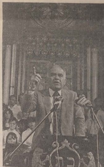
DI Yitzhak Shamir vorbind la Templul Coral

Vă aduc un salut cordial din statul Israel, din partea guvernului israelian, a primului ministru, Menachem Begin, a Knessetului, din partea întregului popor evreu din statul Israel.