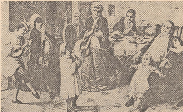
„Purim în familie”, tablou de Moritz Daniel Oppenheim