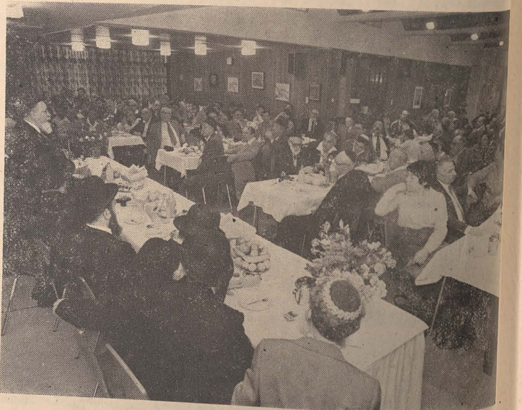
Eminența Sa vorbește la recepția din Natania