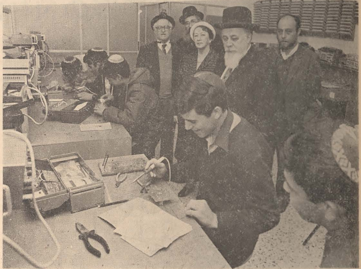
Vizită la secția de electronică a Iesivei „Învățătura și munca” din Kfar-Abraham