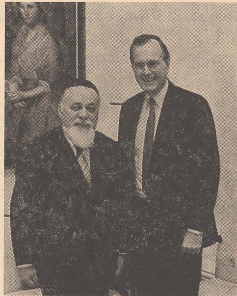
Casa Albă din Washington a trimis Eminenței Sale fotografia luată la întrevvedere cu vicepreședintele Statelor Unite, George Bush.