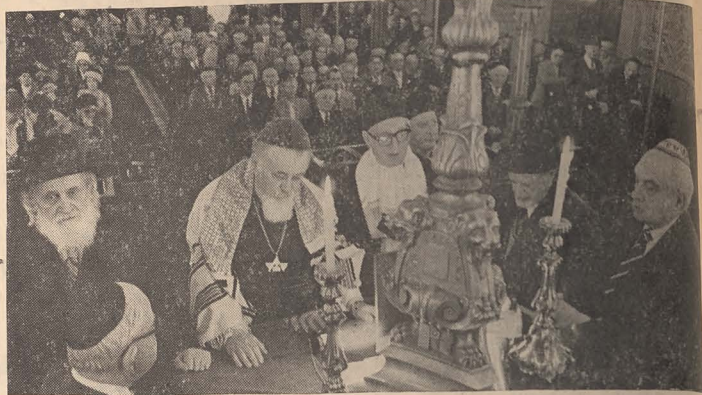
Martirii de pe „Struma“ sînt evocați la Templul Coral — 11 martie 1984