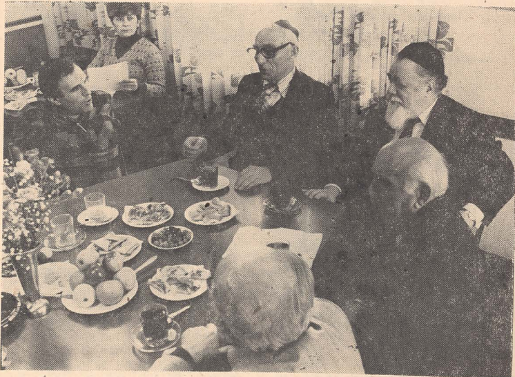
Recepție la Consiliul Muncitoresc al orașului Tel Aviv