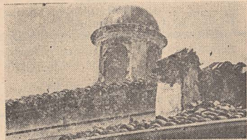
Sinagogă din Lombardia

există din nou o comunitate evreiască în plină dezvoltare. Dacă în 1820 locuiau acolo doar șapte familii de evrei, spre sfîrșitul secolului al XIX-lea numărul lor s-a ridicat la 6 000. Persecuțiile antievreiești rămăseseră de domeniul trecutului. Filmul continuă cu prezentarea unor