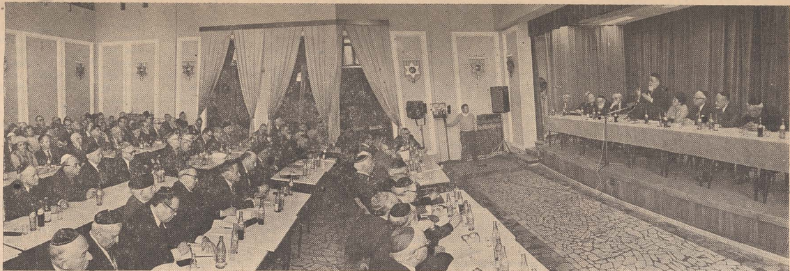
Aspect de la ședința lărgită a Comitetului de Conducere al F.C.E.

Subliniînd importanța Sederelor colective pentru ca toți membrii obștii noastre să cunoască istoria poporului evreu și, în general, buna desfășurare a vieții comunitare sub toate aspectele, Eminența Sa a relevat faptul că toate acestea sînt posibile datorită raporturilor excelente cu organele de stat, care ne acordă tot sprijinul. Eminența Sa a exprimat în treaga grațitudine președintelui Nicolae Ceaușescu pentru înțelegerea față de situația noastră specială, de rămășițe ale Holocaustului.