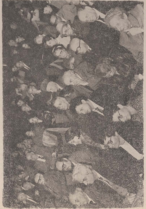
האולם בעת הישיבה

ביום ראשון 10 במרץ 1900 התקיים ייסוד ההסתדרות לידרות הרומנית-ישראלית ששולם את ה'לונה לידרות ישראל רומניה' שנוסדה זה זמן רב. במור נשאו ההסתדרות האחד נבחר מר רוזון