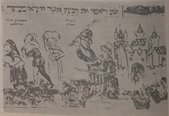
■ Pagină dintr-o Hagada ilustrată din sec. al XV-lea (Franța)

Cea de-a doua parte a programului începe cu prezentarea unei Hagada care nu a fost realizată de evrei. Este vorba de Hagada publicată integral în numărul din 17 august 1849, în ziarul englez „The Times”, aruncînd din nou asupra evreilor infama acuzație că se folosesc de singe la prepararea azimel pascale, scornire care a dus la a-restarea, la Damasc, a nouă evrei, cărora li s-a pus în circă această acuzație. Sir Moses Montefiore a pornit imediat spre capitala siriană pentru a-i salva.