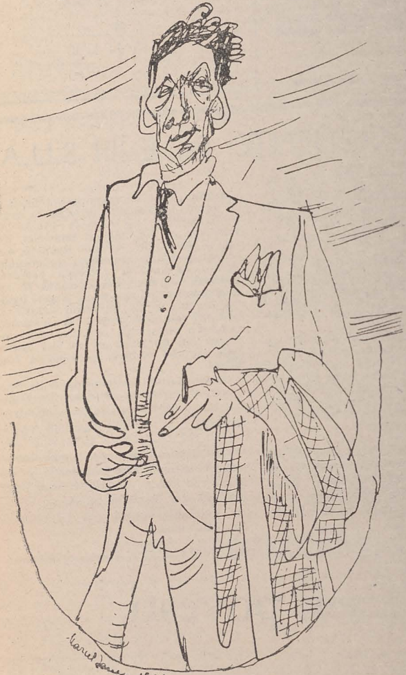
Desen de MARCEL IANCU

Proza românească a fost mai rezistentă decît poezia la demolările avangardiste. Printre cei puțini care, totuși, au cutezat să le întreprindă și aici (Urmuz, Vineu, Ion Călugaru) s-a numărat și JACQUES G. COSTIN.