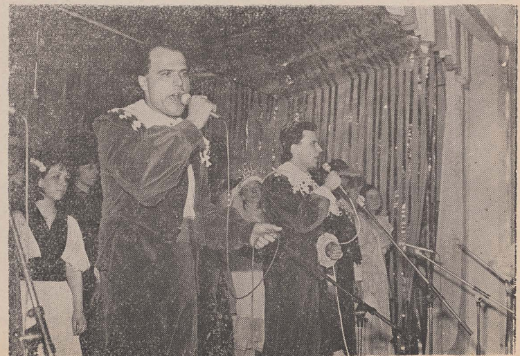
The soloists of the "Shira Vezimra" Choir singing "Ribbono shel Olam"

The kosher restaurants prepared the traditional humentashen, which were distributed to the participants or sent home to the bedridden assistees and to the aged people having no families.