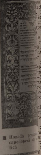
■ Hagada prahizează capodoperă de tipografie

Ces mai impresiona gada pe care au realizat München în care soane rămăne în ma războiului datînd din anul ilustrată cu un Seder în reprezentarea lui lagărelor de minare. Pasajul text s'nt întregi la adresa puterii ar fi putut face în opri acest marelui cut nimic. O dată cu creșterea Israel, numărul de gadot sponsorizate raeliene publice Seder în suplinei. Cel mai frumos nuscrit din Hagada lizat în 1984 de o care artistul a creat un an. Este o colaborată, în care uz de o bogată a nici grație și a nele și motivat trem de compariate. Aumie Seder realizatorii documentise — pe gada lui David le emoții atunci această Hagada după păremi mai reușită din artiste din țile