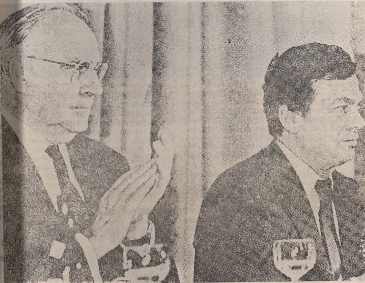
Helmut Kohl și Edgar Bronfman la Sesiunea Congresului Mondial Evreiesc

Este clar drumul pe care-l are de urmat noua Germanie. Poporul evreu se roagă să dovedeți că lumea nu are de ce să se teamă; să urmați calea ce vă îndepărtează de tradițiile rele și vă apropie de cele bune, care vădese adevărata voastră vocație. Marea problemă este edificarea unei Germanii adînc înrădăcinată în pace și în respectul pentru valorile umane universale.