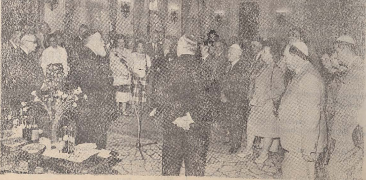
Eminentă Sa aduce un cald elogiu sărbătoritului

Afirm că domnul Șechter ne va lipsi. Mie cel puțin îmi va lipsi mult. Științindu-l în apropiere, am lucrat mai liber, mai degajat, cu mai mult curaj. Dar, pentru că totuși pleacă în Israel, îi urez să fie fericit, să se bucure de liniște, satisfacții și multă sănătate. Să trăiți și să știți că vă vom urma exemplul. Va fi pentru dumneavoastră o satisfacție în plus.