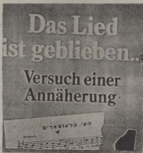
■ Afișul festivalului (fragment)