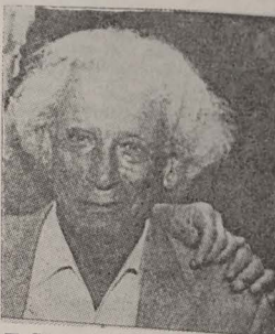
Samuel Fuller și dorința de a nu uita