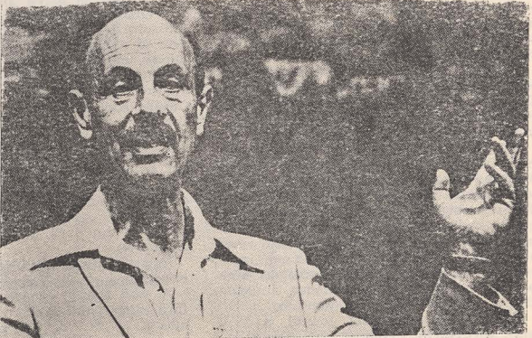
■ Ygael Yadin

Interesant este că acest mare savant a lăsat nu numai descoperirile sale arheologice, dar și o întreagă tehnică modernă de lucru în vederea interpretării datelor descoperite, în folosirea cunoștințelor de filologie, de istorie, ca bază a studierii Bibliei pentru explicitările faptelor istorice.