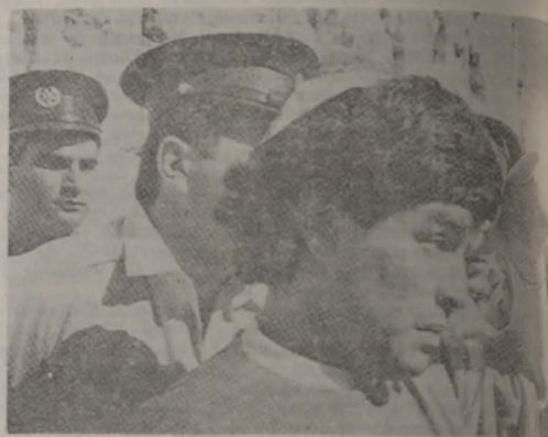
MARADONA la "Zidul de Apus", cu prilejul primei sale la Ierusalim