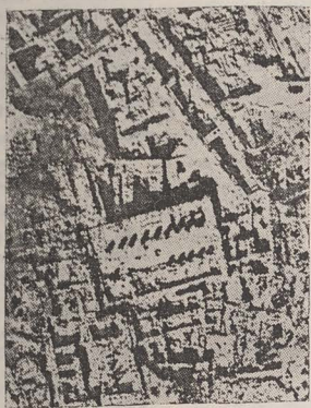
■ Reconstituirea fortăreței lui Solomon de la Hatzor

struită și întărită pe vremea regelui Solomon. Ygael Yadin a reconstituit, pe baza descoperirilor sale arheologice, o parte a Hatzorului, așa cum se presupune a fi fost atunci. Pasionați de aceste investigații, au participat la ele mii de voluntari din