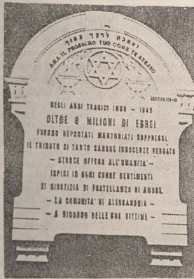
Pe fațada sinagogii din Alessandria (Italia) se află această placă, în memoria evreilor uciși în Holocaustul nazist

Vizitatorul a putut face o plimbare instructivă prin trei milenii ale istoriei iudaismului, transformările profunde sociale, politice și culturale ale populației evreiești din Țara Sfîntă și din Europa alcătuiind punctele culminante ale expoziției: de la regat, la societatea actuală din Israel, pe de o parte, și cele ce privesc Diaspora, în totalitate, pe de altă parte. Descoperirile arheologice, oricît de fragmentare ar fi, dovedesc capacitatea de adaptare a poporului evreu, trecut prin toate evenimentele secolelor.