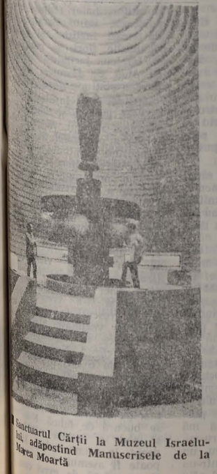
Sanctuarul Cărții la Muzeul Israelului, adăpostind Manuscrisele de la Marea Moartă