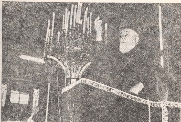
A His Eminence preaching