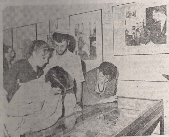
Tineri vizitatori la expozițiile Universității Ebraice

Sub egida Centrului de artă evreiască al Universității Ebraice, a avut loc simpozionul „Artă modernă evreiască: artiști, colecționari și cînturari“. Simpozionul s-a desfășurat în paralel cu deschiderea celui de-al treilea Targ al cărții de iudaistică din Ierusalim, organizat de Departamentul de Iudaistică al Muzeului Israelului. Centrul a fost, de asemenea, co-sponsor la cea de a 22-a conferință a Societății pentru artă evreiască a