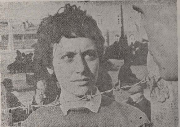
Scenă din filmul „Steaua”, coproducție germano-bulgară, avind ca temă Holocaustul.

* Călugărițele catolice făcînd parte dintr-un ordin înființat în Spania în secolul al XVIII-lea (n. red.).