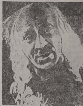
Mihoels în „Regele Lear” de Shakespeare și în „Noaptea în țigul vechi” de Peret

La adunarea de doliu, Alexandr Fadeev, conducătorul Uniunii Scriitorilor Sovietici, arăta: „A plecat dintre noi un artist minunat, aureolat de slavă, de o mărețată slavă, care e sortită nu multor alesi. Este vorba de acei maeștri despre a căror creație însuflețită vor fi scrise cărți, iar numele lor vor rămîne multă vreme, peste veacuri de-a rîndul, vii pentru toți iubitorii de artă. Dar Mihoels n-a fost numai un mare artist, el a fost și un om înzestrat cu suflet mare și cu o excepțională integritate. La el făceau casă bună o imensă dra-