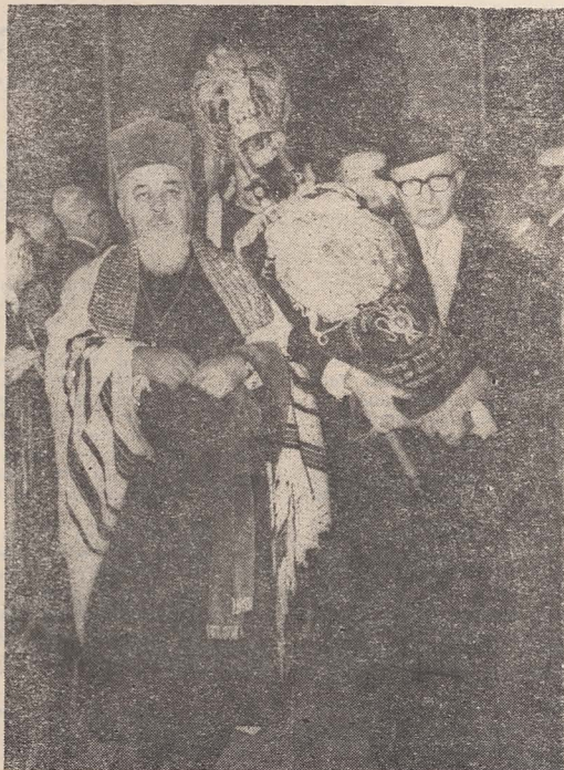
■ Cu Tora în brațe, Begin pășește în Templul Coral