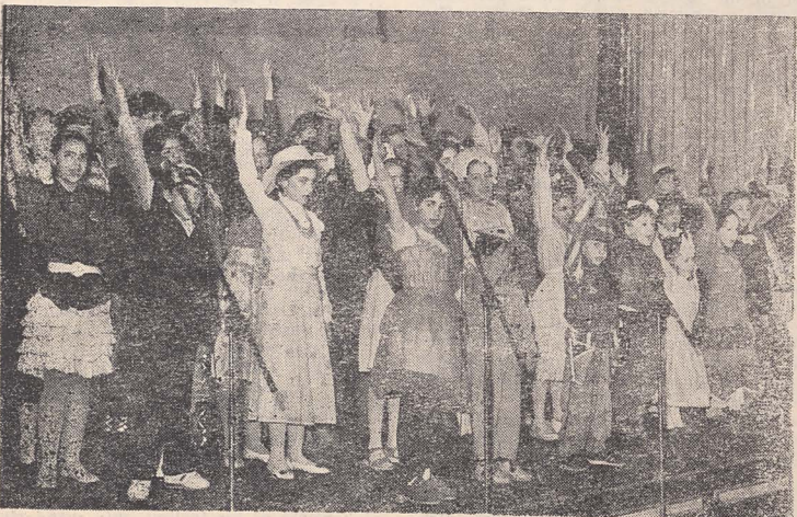
■ The Purim Festivity at the finale