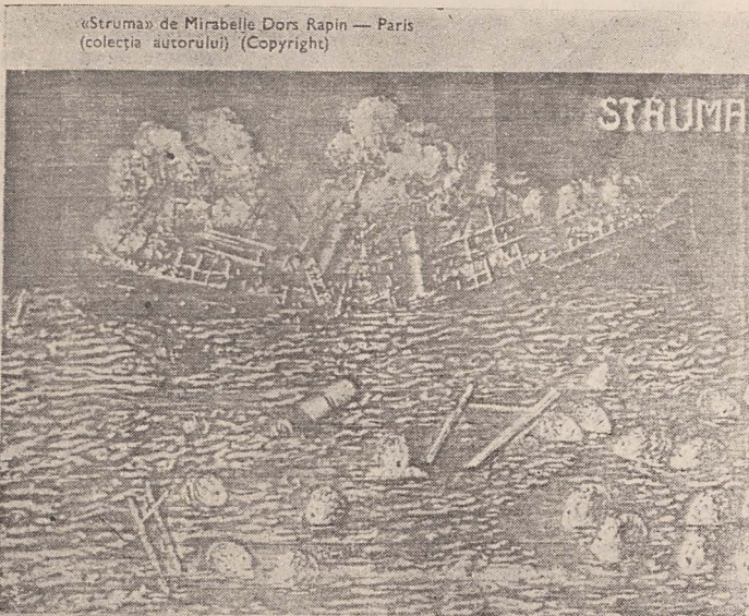
«Struma» de Mirabelle Dors Rapin — Paris (colecția autorului) (Copyright)

În ziua de joi, 12 martie, 7 Adar 5752, s-a oficiat la Templul Coral din București serviciul religios tradițional cu o triplă semnificație în obștea bucură-teană.