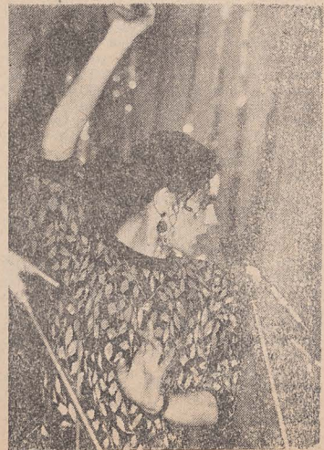
■ Maia Morgenstern