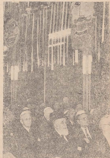
■ Spectacolul de Purim fascinează... În prim-plan — trei personalități pe post de spectatori: Eminența Sa dl Șef Rabin dr. Moses Rosen, Aurel Dragoș Munteanu, ambasadorul României la O.N.U. și dl Cornelii Coposu, președintele P.N.T.-c.d.

Aplaudăm, aplaudăm... Strădanile colective, repetițiile în lanț, reluările perseverente de la capăt, mereu de la capăt, pentru ca în această seară frunțile să se descrețească, grijile să fie lăsate la garderobă, cenușiul să fie abolit și în locul lor să se răsfețe un evantai de culori, lumini și hohote de ris.