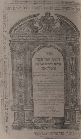
■ Hagada bilingvă (ebraică și italiană) tipărită la Veneția

Punctul culminant al sărbătorii este Seder. În seara primei zile, precum și în seara celei de-a doua, la masa festivă, în fața simbolicei tăvi (Keara), parcurgem filele Hagadei, pentru a ne achita de obligația de „a povesti copiilor noștri despre eliberarea din Mîtraim”, obligație prevăzută în repetate rînduri, în textul biblic. Inițial, Seder avea loc cu ocazia jertfei ce se prezenta an de an, în ajun de Pesah, la Ierusalim. După dărîmarea Sanctuarului, elementul prim al Sederului pierzîndu-și însemnătatea, acesta a devenit ceea ce este și astăzi, o masă festivă intimă, luminoasă, avînd un caracter mai mult instructiv și educativ. Hagada, precum și întreg ceremonialul festiv al serii urmăresc un singur scop: acela de a trezi curiozitatea comensilor, pentru ca ei să învețe din timp să înțieagă și să pretuiască libertatea. „Cele patru întrebări” formează, de fapt, baza Hagadei, ele sînt puse de cel mai tînar comensian și oferă prilejul unui răspuns amplu, plin de înțelepciune, augmentat cu talmăcirii, psalmi și, în sfîrșit, cu o serie de cîntece dedicate exclusiv copiilor. Serile de Seder sînt, fără îndoială, cele mai frumoase seri ale anului evreiesc.