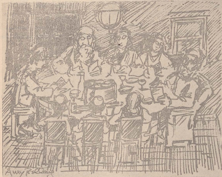
■ Seder. Desen de Amy-Bollag

Opt zile de-a rândul, începând cu a 15-a zi a lunii Nisan, prima lună a anului, luna primăverii, ne considerăm, alături de autorul milenarei noastre Hagada, „ca abia ieșiți din Mîtraim”. Opt zile de-a rândul, uităm data pe care o poartă pe coperta sa calendaristică și ne considerăm contemporani cu strămoșii strămoșii noștri, care, în urmă cu mii și mii de ani, au văzut mijind în fața ochilor lor, în a 15-a zi a lunii Nisan, zorile libertății mult visate. Alături de ei, pomim pe drumul greu, nebatătorit, al istoriei, străbătut de fiorul marilor amintiri, recităm an cu an filele pline de duioase talmăcirii ale Hagadei și ni se pare că, într-adevăr, recitim povestea vieții noastre scrisă de pana măiastră a unui bun cunoscut, care, vreme de mulți ani, ne-a urmărit pas cu pas și a reținut cu o atenție plină de afecțiune tot ceea ce era demn de reținut din câte ni s-au întâmplat. Este, într-adevăr, unul dintre multele miracole ale marilor creații — această permanentă actualitate a lor.