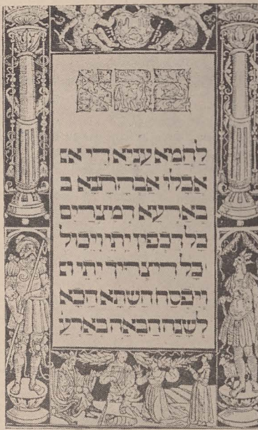
■ Hagada din Praga (1526)

În ajun de Pesah, primii născuți obișnuiesc să postească în amintirea ultimei plăgi, „moartea primilor născuți”. Tot în ajun de Pesah, se fabrica odinioară „Matot Mițva” — ultima tranșă de azimă. Rabinii și enoriașii de vază ai comunităților luau cu această ocazie locul muncitorilor de la fabrica de azimă, frămîn-