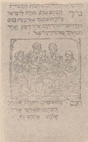
■ Prima Hagada ilustrată a fost tipărită în Spania în anul 1492

treizeci de zile abia dacă ajung. În primul rînd — problema curățeniei. De Pesah, timp de opt zile, nu este permis să se găsească nici o urmă de aluat dospit, nici de pline, nici de paste făinoase, nici dintr-un aliment făcut din aluat. Fiecare colțșor este cercetat și curățat cu aten-