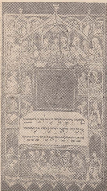
■ Pagină din Hagada Darmstadt (sec. XV)

Pesah începe, de fapt, cel puțin înainte cu o lună de Pesah, dată înscrisă în calendar. Pînă a te așeza la masa de Seder, mai sînt altele de făcut, încît