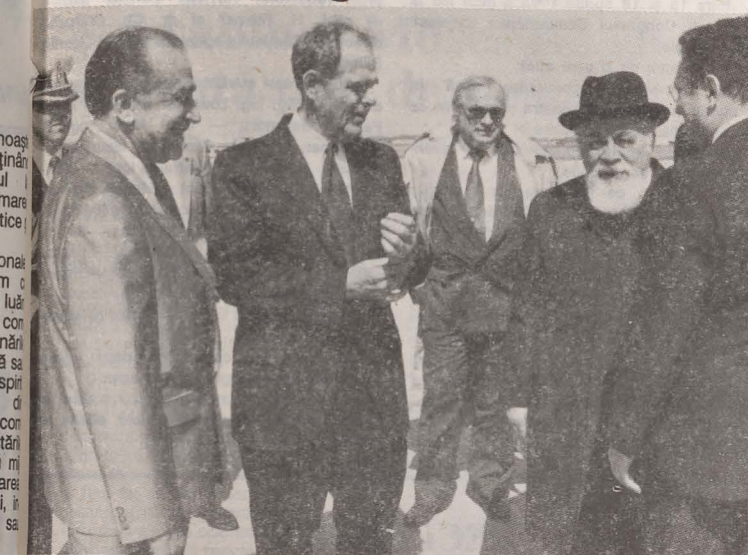
• La sosirea pe aeroportul de lângă Washington