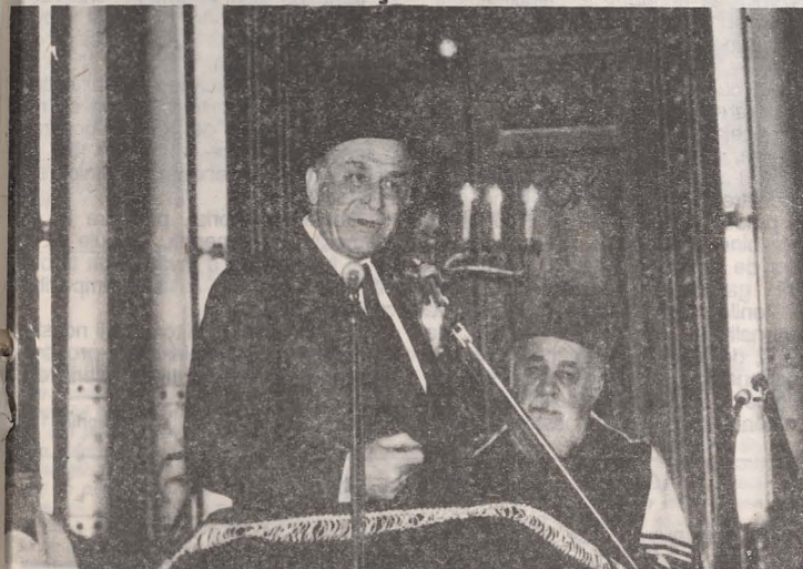
Eminența Voastră, Domnule Șef Rabin, Onorată asistență,

Solemnitatea ce ne reunește azi pentru a omagia amintirea martirilor exterminați de fasciști și nașiști în anii celui de-al doilea război mondial ne îndeamnă să ne plecăm frunțile cu pioșenie în memoria celor dispăruți.