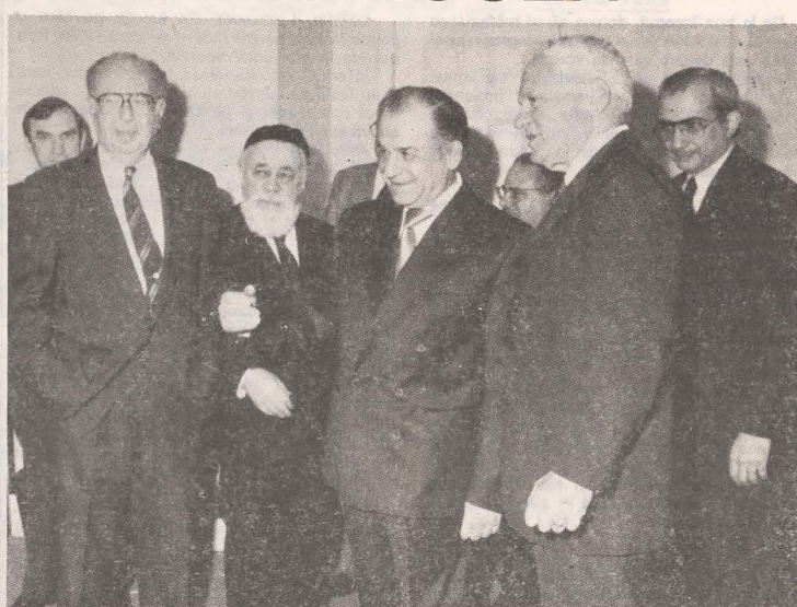
• La întâlnirea cu fruntașii comunităților evreiești din S.U.A.