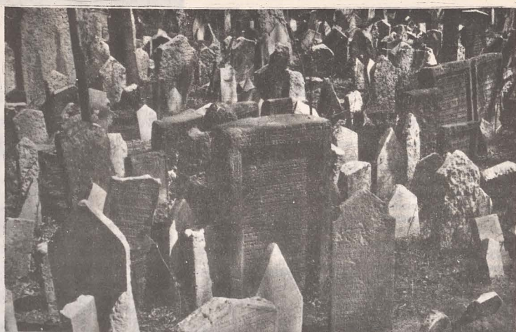
• Vechiul cimitir evreiesc din Praga