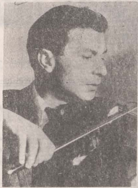
• Nathan Milstein

Ceea ce se numește „publicity” pe Milstein l-a interesat prea puțin. „Dvs. știți doar că oamenii ascultă bucurându-se de povești fascinante. Nu e nevoie tot timpul de acest război. Acesta nu face decât să abată atenția de la calitate și angajare... Nu-mi amintesc ca pentru un concert al lui Heifetz sau Kreisler să se fi făcut prea multă reclamă. Este mai bine să devii cunoscut numai și numai prin calitate”. Publicul îi aprecia modestia. Oriunde și oricând își făcea apariția pe scenă, concertele sale se bucurau de un auditoriu numeros, fiind considerate de melomani drept comori inestimabile, ca și, în zilele noastre, înregistrările sale cu interpretări ale operelor marilor compozitori.