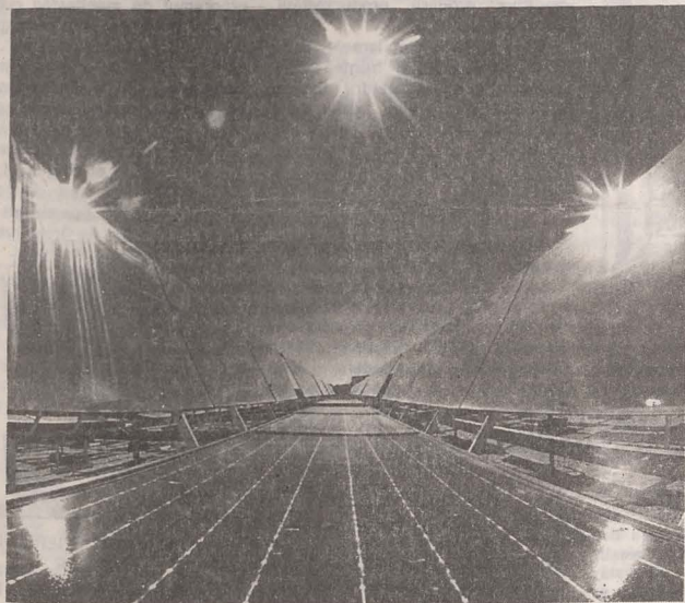
• Captarea fiecărei raze solare. Instalații de heliostat la Rehovot

Problema fundamentală o constituie concentrarea energiei solare. Institutul Weizmann a instalat în acest scop 64 de așa-numite heliostat, niște oglinzi uriașe, cu un diametru de 56 m fiecare. De la aceste oglinzi, energia solară este transmisă către un turn solar și convertită în energie electrică.