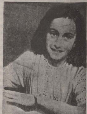
• ANNE FRANCK

În timpu-aceia greu, cumplit, Cînd ni se pregătea măcelul, Noi l-am avut pe Dumnezeu! Acum avem și Israelul.