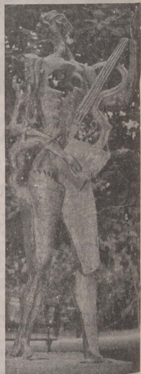
• Sculptura lui Ossip Zadkin: „Poetul” în „Jardin de Luxembourg” — Paris.