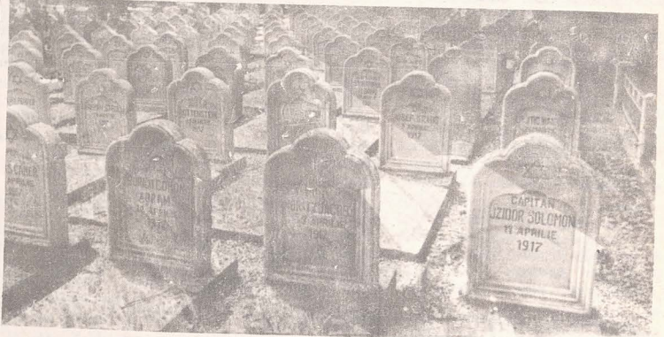
• Alea erolor (cimitirul din Iași)

În numele populației evreiești din România, Eminența Sa dl Șef Rabin dr. Moses Rosen a participat la festivitățile de la Alba Iulia, omagiind astfel actul istoric de la 1 Decembrie 1918.