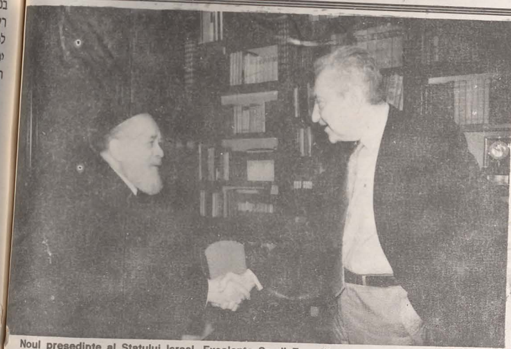
Noul președinte al Statului Israel, Excelența Sa dl Ezer Weizmann, întâmpină la Palatul prezidențial din Ierusalim pe Eminența Sa dl Șef Rabin dr. Moses Rosen. (3 noiembrie 1993)