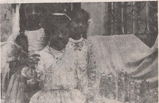
● Trei fetițe sărbătoresc Simha Tora în Sinagoga din Bombay