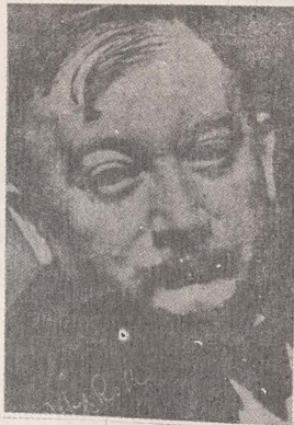
● Joseph Roth

psiholog Manes Sperber (1905-1984). Volumul este prefațat de Elie Wiesel și încearcă să ne propună câteva răspunsuri la problema: a fi evreu, deși, această chestiune nu admite decât un răspuns personal”. Manes Sperber a fost un intelectual angajat, dornic de pace și dreptate, fiind din copilărie până în ultimele zile ale vieții sale hrănit de textele biblice. Într-unul dintre articolele adunate în acest volum se vorbește despre înfrângerea nazismului, despre Ierusalim, despre destinul literaturii și al scriitorilor idiș. Manes Sperber a pătruns în adâncul problemei evreiești și a căutat, pentru evrei și cu evreei, drumul unei identități, propunând fiecăruia dintre noi interesul pentru rădăcini, pentru originea noastră ca popor.