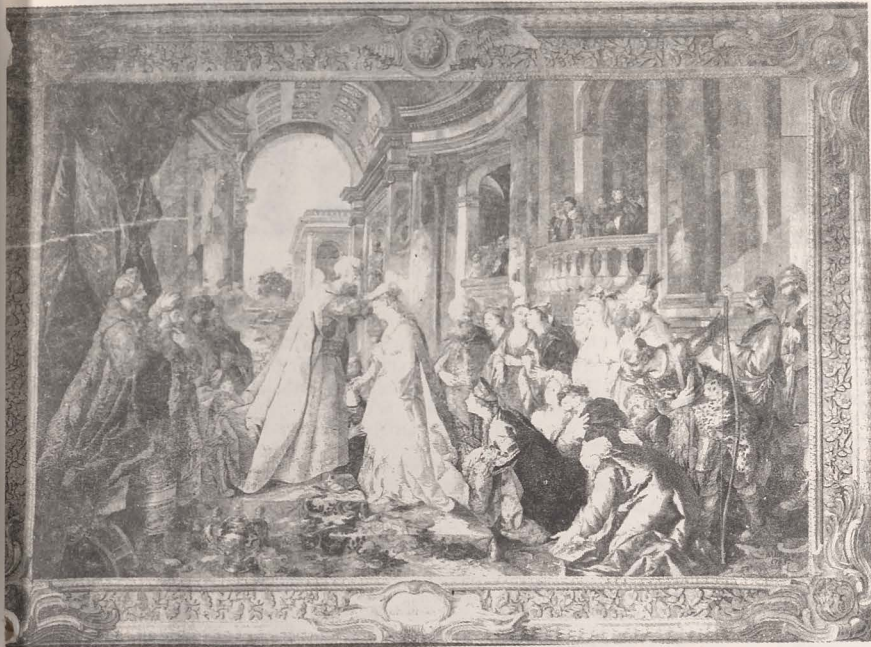
● Goblen reprezentând încoronarea Esterei

Una dintre gloriile „Meghilei” este și aceea că a îmbogățit și îmbogățește fantezia artiștilor, constituind o sursă de inspirație pentru mulți traditori ai verbului și ai penelului. Dacă l-am aminti numai pe marele Rembrandt, al cărui tablou „Esther și Ahașveroș” se află la Ermitajul din St. Petersburg, sau pe Racine, cu celebra piesă „Esther”, care încă se mai prezintă ocazional