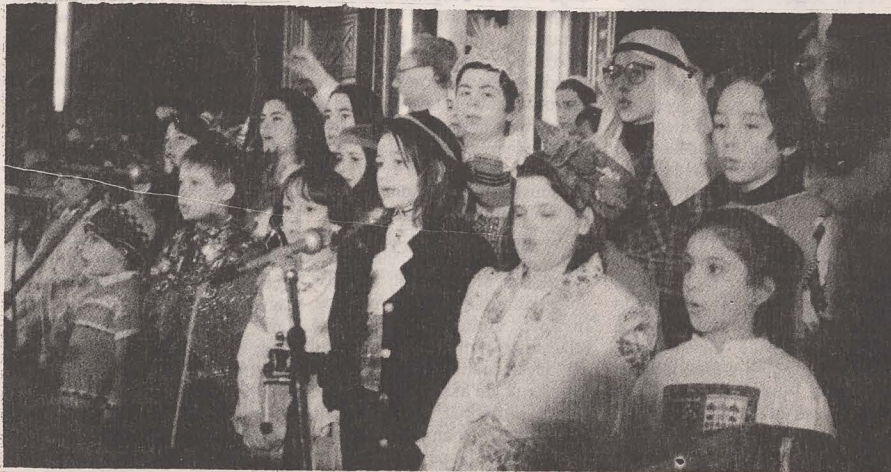
■ La Templul Coral din București