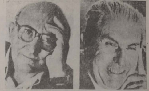
● Aharon Appelfeld

opera lui Roth. Conținutul deosebit de bogat al lucrării include și numeroase fotografii și documente inedite, despre viața și activitatea multilaterală a marelui prozator și jurnalist evreu.