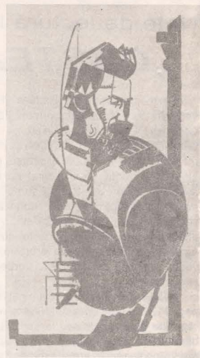
■ C. BRÂNCUȘI