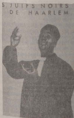
■ Cantor din New York