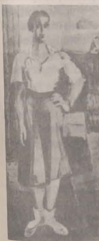
■ FICA MEA