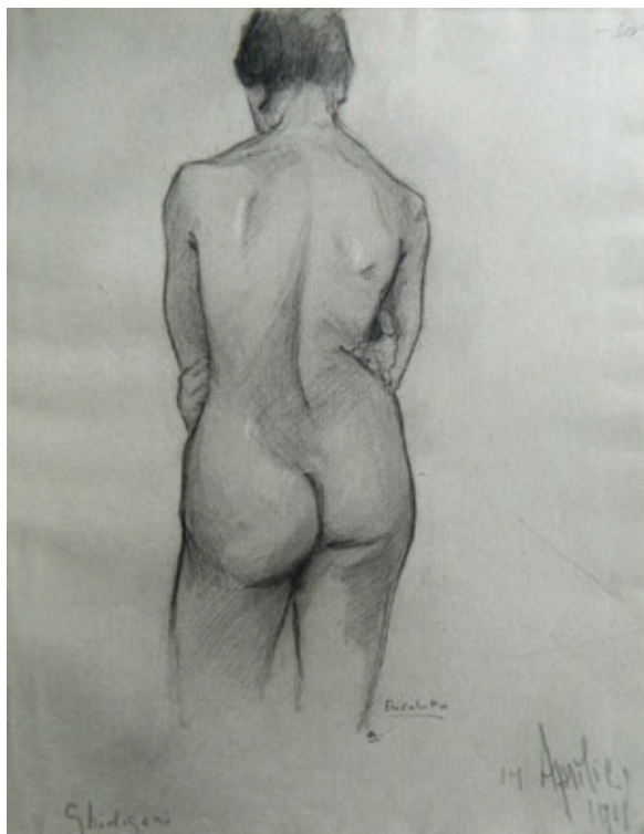
Nud cu spatele