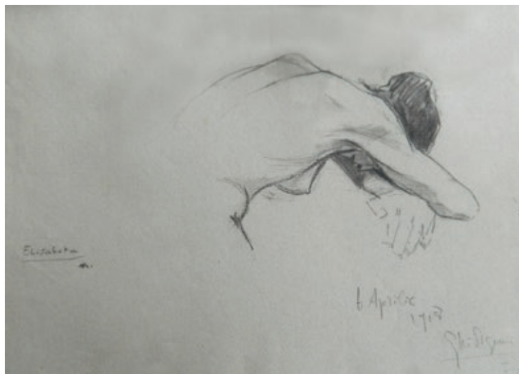
Fig. 2 Nud

prea îndrăgostită de propria ei frumusețe, prea sigură de puterea pe care e convinsă că o are asupra celorlalți și, din cauza aceasta, prea indiferentă la felul de bărbat pe care l-ar atrage. Adoră să fie admirată și deocamdată, se iubește pe sine mai mult decât pe oricine altcineva, deși e departe de a fi cu adevărat mulțumită de propria persoană ". (Maria, Regina României, vol. II, 2015, 213)