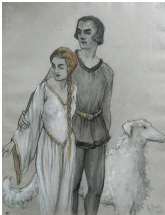
Fig. 6 Ilustrație de carte