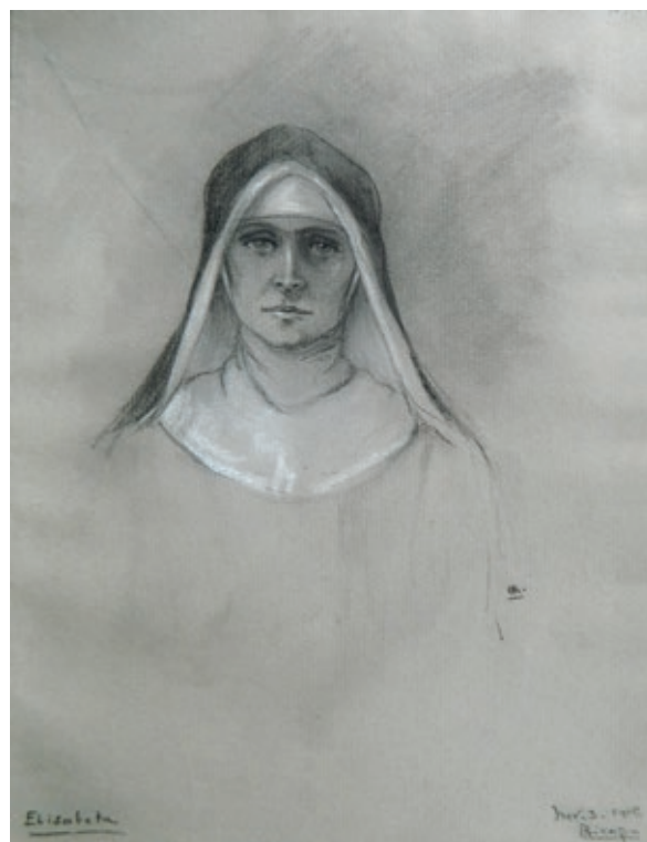
Fig. 7 Măicuță

partea stângă și datat în dreapta jos. Nu a uitat să treacă și locul unde a fost desenat, poate pentru o mai bună aducere aminte (fig. 2).