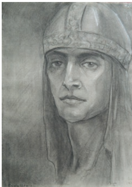
Fig. 10 Cavaler

vorbea cu multă dragoste și recunoștință despre măicuța venită din Italia ca un înger trimis de Dumnezeu.