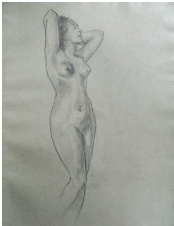
Fig. 8 Nud