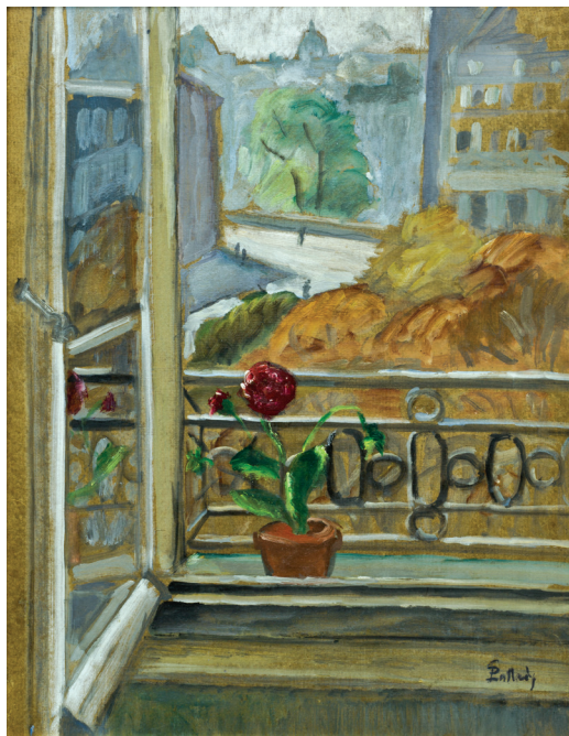
Theodor Pallady Peisaj urban