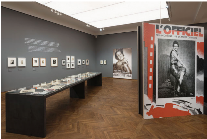
Muzeul Leopold, Viena – model pentru o expoziție de artă grafică, detaliu

Sistemele de prindere și panotare se vor adapta pentru aceste schimbări. Textele de sală vor fi concepute flexibil și trebuie să cuprindă o prezentare generală a artistului, viața și activitatea acestuia și caracteristicile principale ale stilului artistic al perioadei și modul specific în care acesta s-a manifestat în România. Prezentarea lucrărilor se va face punctual, prin comentarii pe eticheta individuală a obiectului. Odată cu rotația lucrărilor se vor modifica doar etichetele, iar panourile generale rămân fixe.