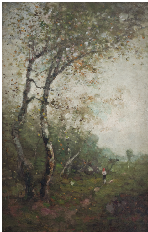
Nicolae Grigorescu În lumină

1. Artă sfârșitului de secol XVIII și cea a începutului de secol XIX – perioada fanariotă, la final, marcată de pătrunderea neoclasicismului.