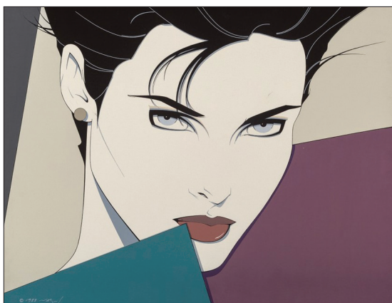
Fig. 3 Fără titlu , acrilic pe carton