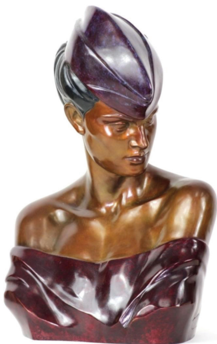
Fig. 2: Bust of a woman , bronz cu policrom, 1984