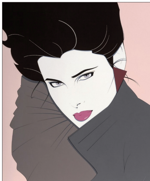
Fig. 5 Fără titlu , acrilic pe carton