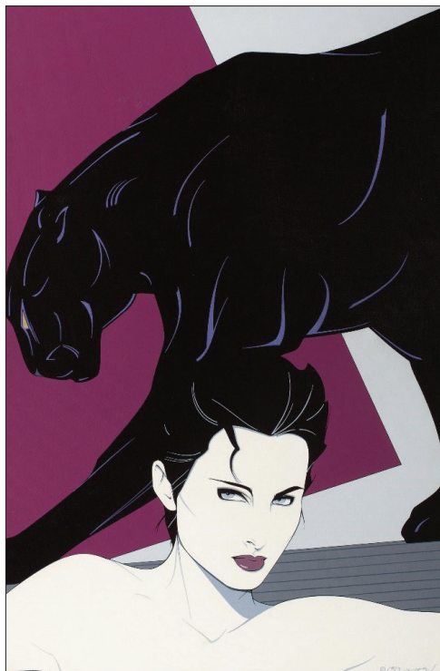
Fig. 4 Fără titlu , acrilic pe carton