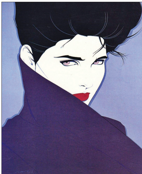
Fig. 1 Fără titlu , acrilic pe carton