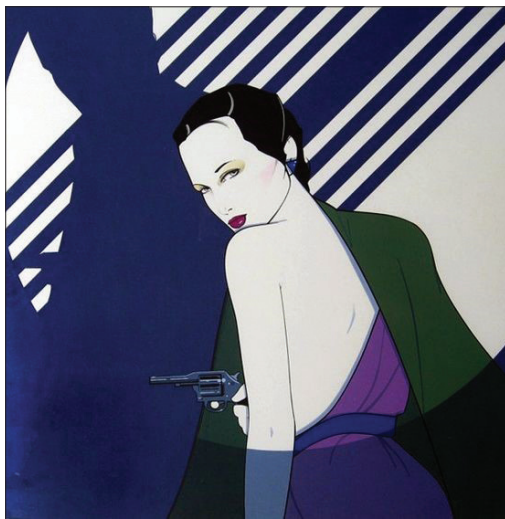
Fig. 7 Fără titlu , acrilic pe carton