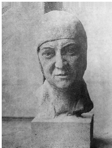
Fig. 4 - Cap de tânără fată, imagine publicată în Ilustrațiunea Română , 20 ianuarie 1932

să ofere ajutor copiilor orfani, bolnavi de SIDA, de pe teritoriul României. Simțul datoriei a rămas bine întipărit în sufletul și în mintea Ilenei și, după cum obișnuia regina Maria să spună: „ Ileana avea din naștere, sentimentul de „noblesse oblige” și era o adevărată plăcere să vezi câtă grație putea avea acest copil ”. (Maria, Regina României, vol. III, p. 331)