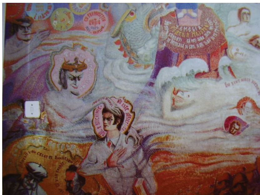
Fig. 6 detaliu din fresca "Biserica și Lumea"