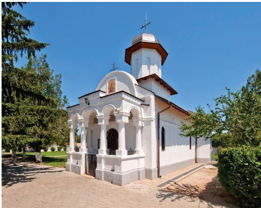
Fig. 3 Biserica de la Drăgănescu