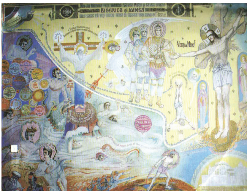
Fig. 4 Biserica și Lumea – partea stângă a naosului, Biserica Drăgănescu