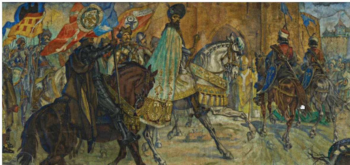
Fig. 2 Mihai Viteazul intra în Alba Iulia, Ateneul Român