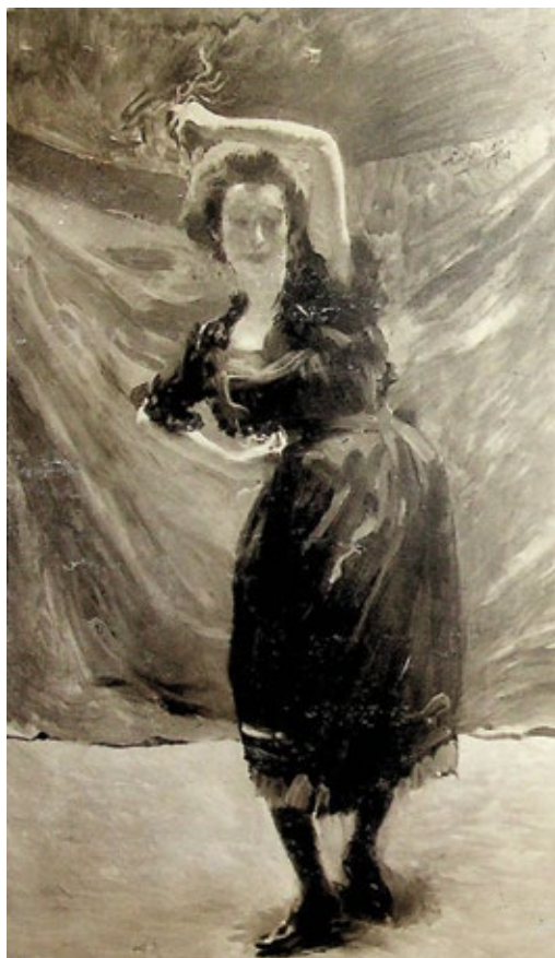
Paul-Albert Besnard Dănuitoare spaniolă