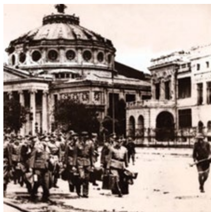
Foto: Clădirea Ateneului Român distrusă de bombardamentele germane (în dreapta, un fragment al Casei Boerescu) (detaliu)