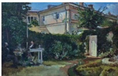
Casa pictorului Ulei pe lemn, 23x35,4 cm