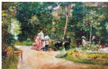
În grădina autorului Ulei pe pânză, 31x49,5 cm