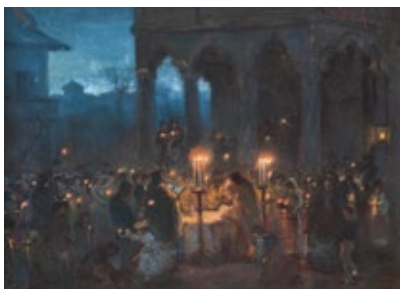
Slujba Învierii la Stavropoleos Ulei pe pânză, 25 x 32 cm, 1864