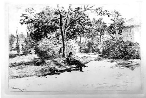
Lectură pe o bancă în Cișmigiu Aquaforte pe hârtie, 7,2x11,1 cm, 1879

între momentele de după îndeplinirea misiunii de dascăl și cele în care se așeza în fața șevaletului sau lua dălțița să sculpteze, ori să zgârie cu acul vreo placă de gravură.