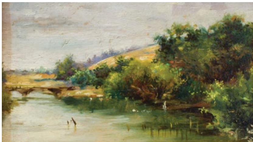
Pe malul lacului de la Herăstrău