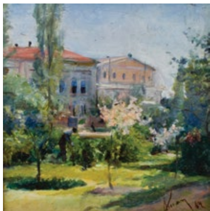
În Cișmigiu Ulei pe lemn, 9,8x9,2 cm, 1873

Grădina Cișmigiu, cel mai vechi și iubit parc din București, l-a atras și pe maestrul Aman cu frumusețea peisajului său. Într-una din bijuteriile sale miniaturale ne oferă un colț din Cișmigiu, într-o zi de primăvară a anului 1873. Lucrarea, tratată într-o manieră liberă, alternând zonele cu pensulație lisă cu cele în tușe nervoase și ușor împăstate, mizează pe efectele de lumină, pe cromatica delicată și surprinde perfect atmosfera și culorile anotimpului. Este uluitor cum reușește ca, pe o suprafață de numai câțiva centimetri pătrați (9,8x9,2 cm, una dintre cele mai mici suprafețe pictate în ulei din colecția muzeului), să ne