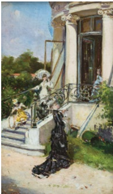
Pe terasa Boerescu Ulei pe lemn, 15,5x9,9 cm, 1878

Un veritabil document de epocă este lucrarea Privire din atelierul cel mic , atelier aflat la etajul casei, cu fereastra dispusă pe fațada nordică. O lucrare de o factură aparte, modernistă prin tratare, ce oferă deschiderea spre un plan secund, prilejuind o panoramare a zonei de peste drum. O pictează pe soția sa în fața acestei ferestre ample, până la podea, prin care se zărește terenul ocupat atunci, pe la 1870, de grădinile Episcopiei Râmnicului, teren pe care abia în 1888 avea să se ridice Ateneul Român. Peisajul, cu acel teren viran, construcții modeste, turlele unei biserici, ale metocului Episcopiei Râmnicului și Ulița Clemenței trasată ca o cărăruie trecând prin fața casei, amintește de faptul că ne aflăm la periferia orașului și nu în centrul Bucureștiului, ca astăzi (Bogdan, 1955, p. 53). Doar Casa Aman este reperul arhitectural cel mai vechi, rămas intact, pe această stradă.