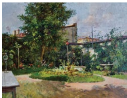
În grădina artistului Ulei pe lemn, 26,5x35 cm