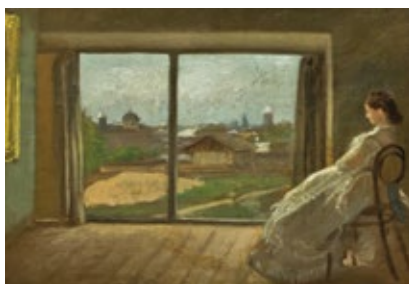
Privire din atelierul cel mic Ulei pe pânză, 32,5x40,5 cm

tehnică și stilistică a picturii lui Aman, apropiindu-l, într-un anume fel, de marii artiști ai impresionismului francez (Șuteu, 2017, p. 147). Sunt fie peisaje, fie scene de gen în peisaj, prilej de a surprinde vegetația luxuriantă, lumina specială a unui moment al zilei, atmosfera tihnită a ceasurilor de socializare într-un cadru intim, crâmpie din viața artistului, ce-și găsesc corespondentul în viețile contemporanilor lui.