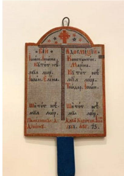
Pomelnic moldovenesc, sec. XIX