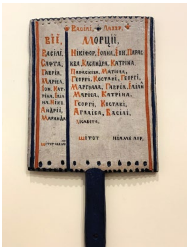
Pomelnicul lui Vasili Lazăr, sec. XIX