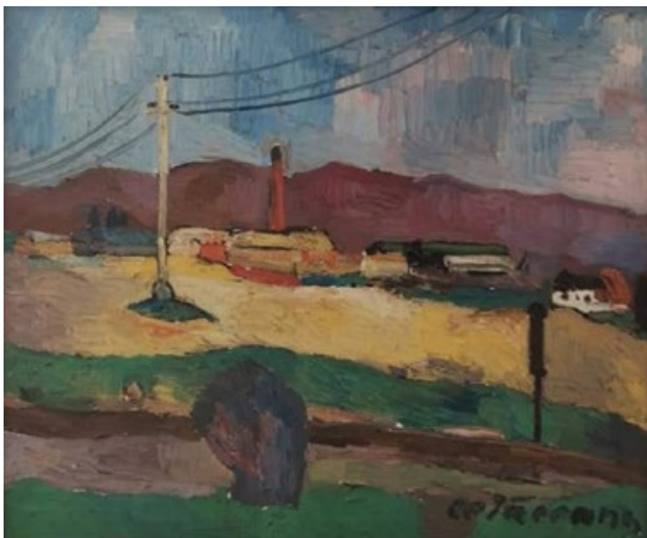
Constantin Cerăceanu, Peisaj industrial