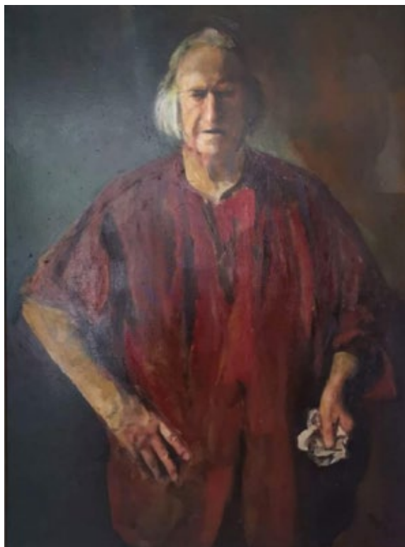
Corneliu Baba, Autoportret