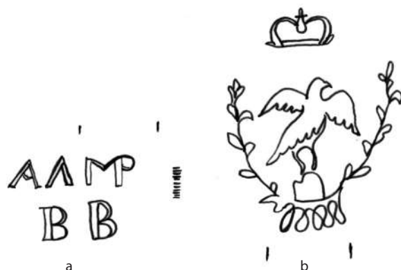
Fig. 2. Filigranul hârtiei produsă la Moara de la Ciorogârla

Primul filigran al acestei mori este publicat în anul 1964 de Aurel Dîmboiu 35 . Autorul lansează cu această ocazie două teze lipsite cu totul de acoperire: 1) toate cărțile de la 1796 la 1806 au fost tipărite pe hârtia de la Cațichi; 2) Fabrica... supraviețuiește până prin anii 1824-1825 36 .