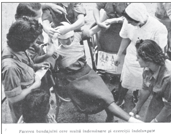
Facerea bandajului cere multă îndemânare și exerciții îndelungate