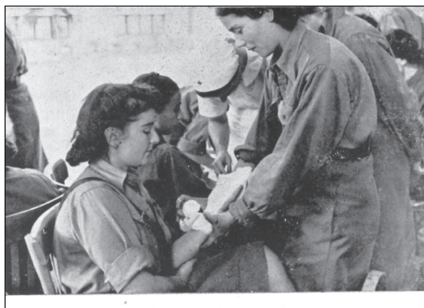
Atenția și îngrijirea pacienților