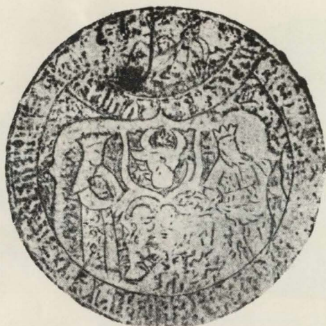
1. Fotografia sigiliului lui Mihai Viteazul, 1600. (Docum. 27 Iulie 1600. Arhivele Statului, București).