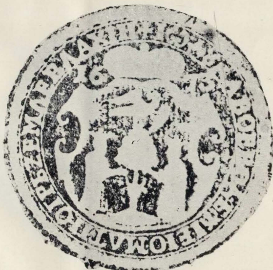
2. Sigiliul domnesc al lui Duca Vodă, 1673. (Docum. XLV, 22, Academia Română).