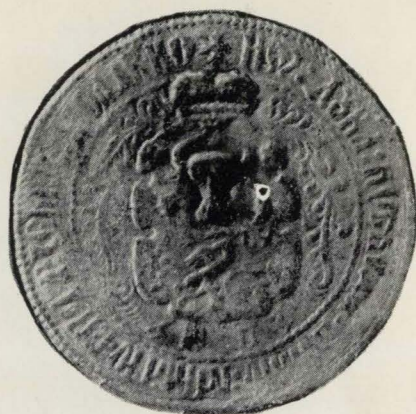
2. Sigiliul domneste al lui Duca Vodă, 1679 (Docum. LXXVIII, 5, Academia Română)