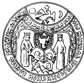
Fig. 1. Reproducerea în desen (greșită) a sigiliului lui Mihai Viteazul depe docum. din 27 Iulie 1600 (Arhivele Statului, București).

Câțiva ani în urmă (1911) d. Stoica Nicolaescu, cunoscutul slavist, a publicat în Revista pentru istorie, arheologie și filologie 12 docu-