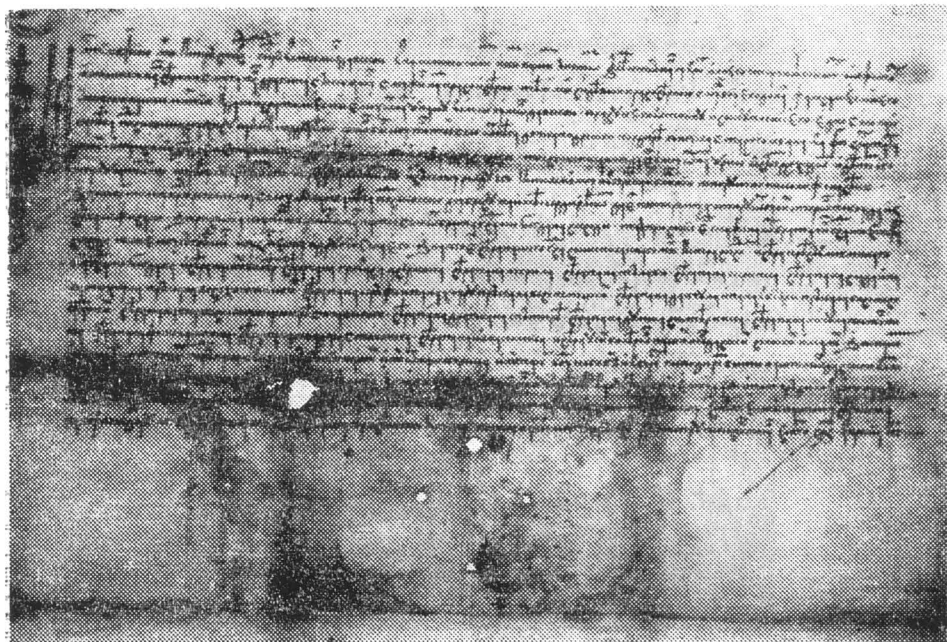
Documentul nr. 2.

2 1529 (7037) aprilie 23, Hîrlău . Petru Rareș vv. Moldovei întărește lui Dragotă Săcuiașul, pentru dreaptă și credincioasă slujbă, satul Cordăreni pe Iubăneasa, sub Dumbrava Înaltă, pe care acesta l-a cumpărat de la Neaga, fata lui Andreico Cordar, nepoata lui Iuban cel Bătrîn, pentru 580 zloți tătărești, deoarece privilegiul de cumpăratură ce l-a avut de la Bogdan vv. i-a fost rupt de Ștefan vv. „cînd