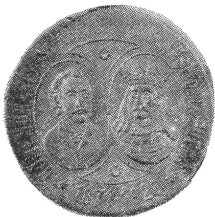
Fig. 3—Medalia emisă în 1926 de Societatea „Arborcasa” din Cernăuți.