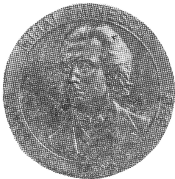
Fig. 7—8. Medalia Eminescu—Creangă bătută în 1989 prin grija Secției Iași a Societății Numismatice Române.