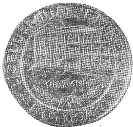
Fig. 5—Medalie emisă cu prilejul sărbătorii liceului „Mihai Eminescu” din Botoșani