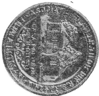
Fig. 4—Medalie bătută de Asociația Filatelieștilor din România Filiala Botoșani