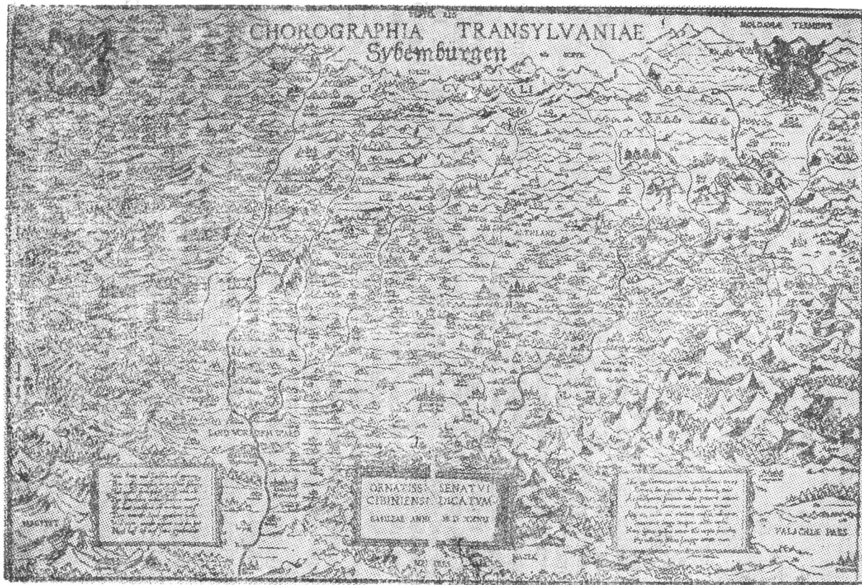
4 — J. Honterus, Chorographia Transilvaniae , Basel, 1532.