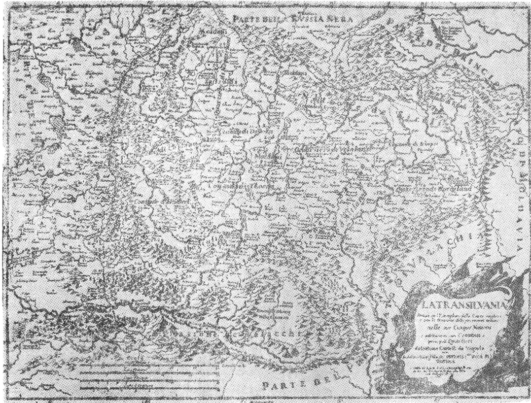
3 – G. Cantelli da Vignola, La Transilvania , Roma, 1686.