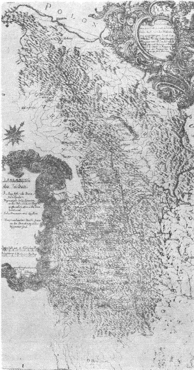
2 — F.J. Fichtel, Bersteinerungen des Grossfürstenthums Siebenbürgen , Nürnberg, 1780.